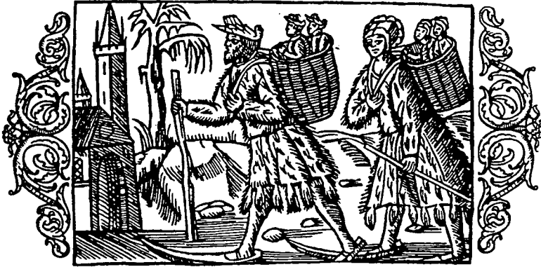
Barndop bland skogsbygdens folk. Familj på väg till kyrkan med nyfödda barn i korgar. (Olaus Magnus 4:17)

i en kontraktsrelation till varandra (Nicholson 1983, Jonasdottir 1983). Gobietti slår fast att dessa filosofer tar upp en juridisk vokabulär för att konstruera en politisk filosofi (Gobietti 1992:11).