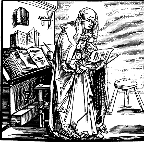
Nunna i sin cell. Tyskt träsnitt från 1500-talet. (Ur Uttrio, K. Evas döttrar , s.111)

to a more popular audience for archaeology, so that in museums displays showing 20th century stereotypes about men and women's work in the past, we will actually start thinking more critically about how we present humankind in the past to the wider public of archaeology.