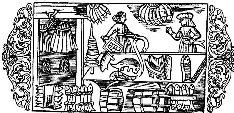
Fiskförsäljning (Olaus Magnus 20:26)

fram til middelalderens samfunn. Jeg ser gjerne at denne forskningen tar utgangspunkt i problemstillinger som tydelig tar kvinners medvirkning på alvor, f.eks. ved å bruke kjønnsroller som analytisk redskap.