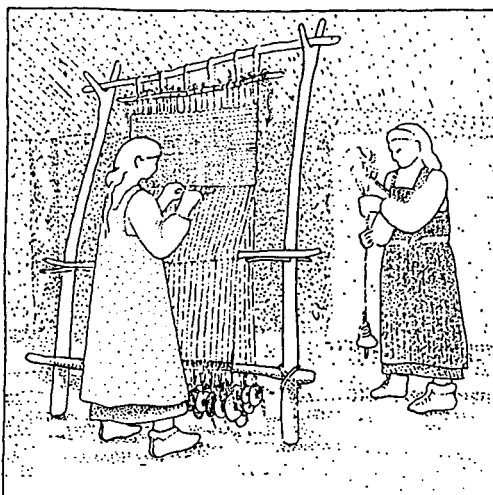
Vävning med stående vävstol. (Teckning av M. Centervall i Jacobsson, B. & Wallin, L. Trelle- borg under vikingatid och me- deltid. 1986)

derarkeologen kan det faktisk også like gjerne være (som før) byers framvekst og oppkomst. For en feminist vil imidlertid ikke det primære være å se dette i forhold til kongemakt og handel, men i forhold til kvinners liv og vilkår. Ved å sette et kritisk lys på forskningen søker feministen å gi dagens kvinner en historie bygd på våre premisser. Den angår selvfølgelig ikke bare kvinner. Ved å introdusere et nytt perspektiv og aktivisere andre kilder utdypes og nyanseres bildet av vår felles fortid.