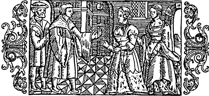
Bröllop (Olaus Magnus 14:8)

Denna gång från fransk horisont, vilket även återspeglas i det geografiska område som behandlas. Georges Duby och Michelle Perrot står som huvudredaktörer för hela serien. Den engelska utgåvan av medeltidsdelen, som presenteras här, har över 10 olika medförfattare. De flesta arbetar utifrån ett mentalitetshistoriskt synsätt med historiskt käll- och text material. Ur dessa texter plockas ett sorl av medeltida röster fram, ibland överensstämmande, ibland disparata i sina åsikter. Det är ingen lättfångad eller enhetlig bild som presenteras läsaren.