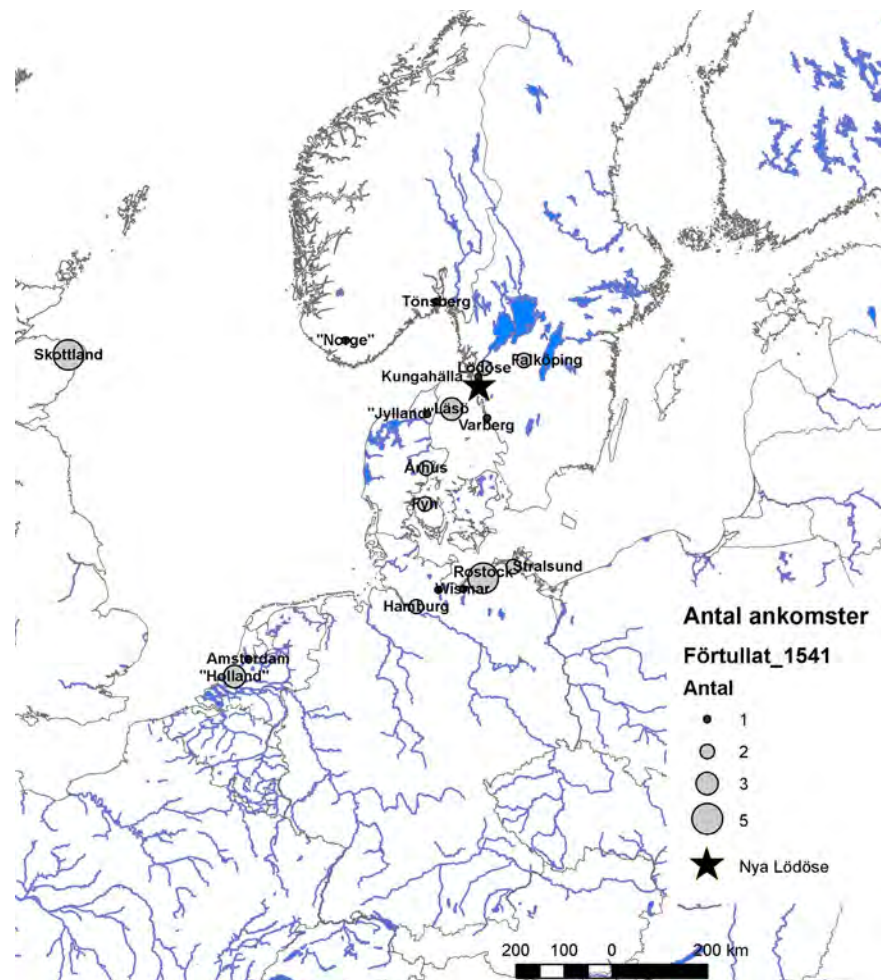
Figur 4. Kartan visar de orter som nämns i Nya Lödöses tullängd 1541 och antalet ankomster från respektive ort.

tande privilegier här. En del av handeln mellan den svenska kronan och de holländska köpmännen gick denna väg, även om mycket fortfarande också fördes via Nya Lödöse. Karl IX:s Göteborg brändes under Kalmarkriget och återuppbyggdes aldrig (Scander 1975).