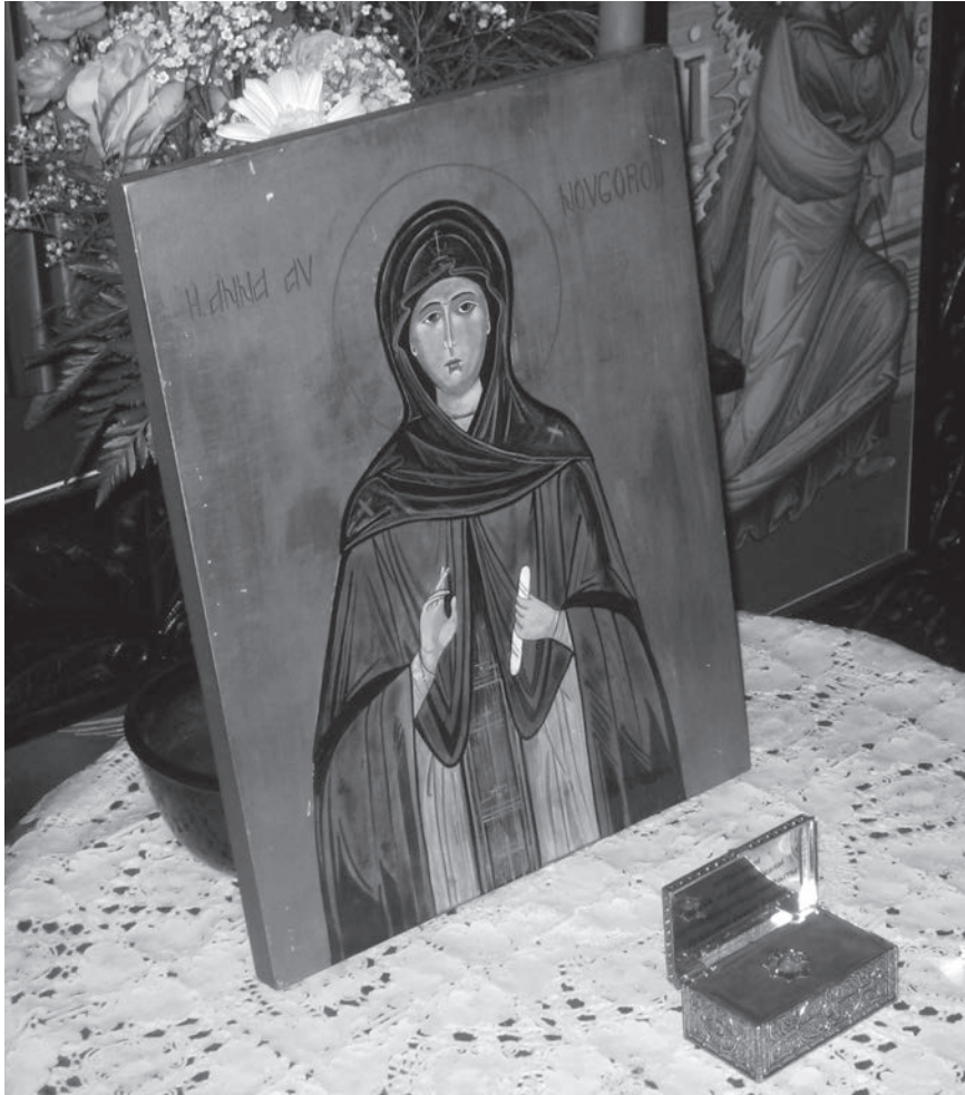
Figur 1. Ikon med Heliga Anna av Novgorod (dvs Ingegerd). I skrinet en relik, överlämnad från Moskva till en svensk ortodox församling 2009.

hämtades då upp ur det förflutna och laddades med nytt innehåll.