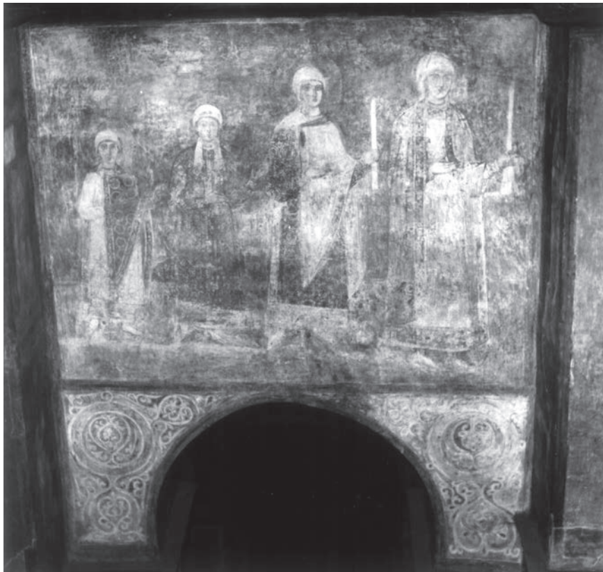
Figur 2. Fyra av Jaroslavs och Ingegerds barn i Sofiakatedralen i Kiev. Anna kan vara den första eller andra personen från vänster. De nästan 1000 år gamla freskerna är svårt skadade och många gånger restaurerade. Hela storfurstefamiljen var ursprungligen avbildad, men detta är det bäst bevarade väggpartiet.