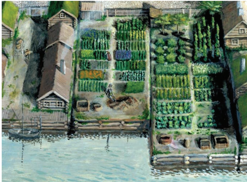
Figur 5. Exempel på konstruktion med timrade kistor som fylls upp med olika typer av material och sedan nyttjas för olika ändamål (Illustration Jens Heimdahl 2014).

Det kanske är den här typen av strandnära byggnationer vi främst förknippar med medeltida hamnstäder och urbaniseringen. Ett gytter med träkonstruktioner som förbättras och byggs ut succesivt i