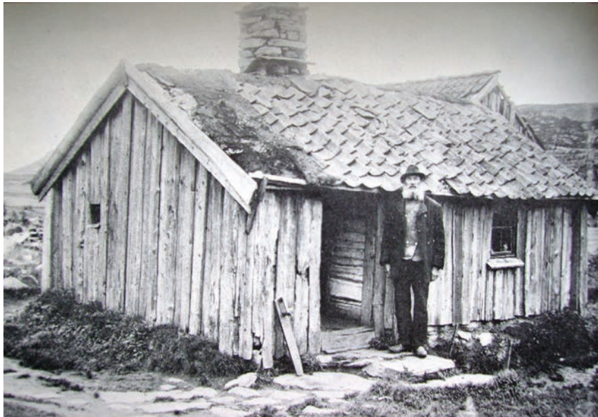
Figur 1. Torpstuga i Bohuslän, tidigt 1900-tal.

relation till årtalet 1850 är ytterst oklar. Många nya typer av fornlämningar är dessutom dåligt inventerade och registrerade, vilket innebär att de löper större risk än andra typer av lämningar att förstöras av ovarsamhet, exempelvis i samband med skogsbruk. Det finns således ett stort behov av att utveckla metoder kring inventering, registrering och kunskapsspridning om den här typen av lämningar till stora grupper, både inom och utom den antikvariska världen. Många av de här ”nya” fornlämningarna är också sådana som framför allt kan knytas till den stora gruppen obesuttna i samhället.