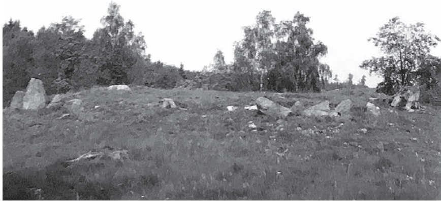
Figur 2. Den kvadratiske stensättningen, fornlämning 50, sedd från sidan före undersökningen.

varit en vishusbod, en så kallad fatbur.