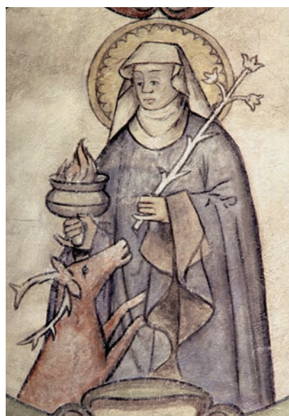
Figur 2. Katarina av Vadstena. Söderala kyrka, Hälsingland. 1500-talets första fjärdedel. Foto Lennart Karlsson, Statens historiska museer.

Den tredje och sista gruppen har en rak, ofta låg, överdel och skaft. Exempel finns i Gökhemms kyrka i Västergötland i Enångers kyrka i Hälsingland och i korportalen i Burs på Gotland (se fig. 3 och 4).