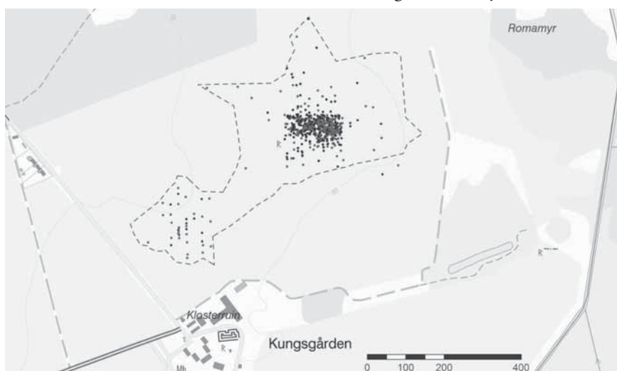
Figur 2a. Spridningen av vikingatida mynt och viktlojd i Guldäkern norr om Roma kungsgård. Ljusl/ röda punkter är mynt och mörka/blå viktlojd. Karta: Amanda Karn och Ny Björn Gustafsson.

Undersökningarna har förstärkt bilden av fornlämning RAÄ 85 men har också avslöjat en omfattande vikingatida verksamhet inom en sträcka av en dryg kilometer längs den forna insjöns strand öster om Kungsgården, bland annat inom den numera uppodlade Kräklinge Tingsängen. I dess norra del har någon form av gårdsbebyggelse varit belägen, både under äldre och yngre järnålder (RAÄ Roma 84:1/L1976:9608). Bebyggelsen ser ut att ha övergivits eller flyttats runt 1100.