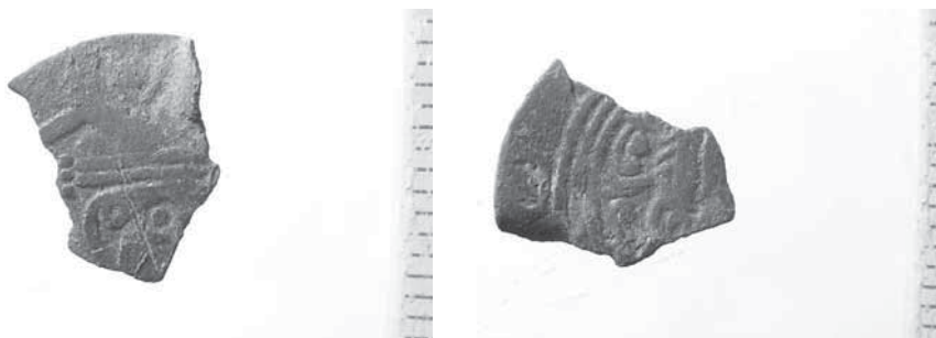
Figur 4a och b. Mynt präglat i Tabaristan cirka 780. Tabaristan låg i norra delen av nuvarande Iran och söder om Kaspiska havet.

att fyndmaterialet i både Guldåkern och Kräklinge Tingsäng är speciellt. Bland annat har ett ovanligt tidigt och ett ovanligt sent tyskt mynt hittats i vardera området (Jonsson 2017, s. 25–34). En speciell fyndgrupp från Guldåkern är dessutom sex tidiga arabiska mynt, så kallade arab-sassanider, som ligger nära varandra i tid. Mynten har präglats i Tabaristan på 770- och 780-talet. I skattfynden från Gotland, som tillsammans innehåller 180 000 mynt, finns sammanlagt endast fem mynt av samma typ, alltså färre än de som har hittats i Guldåkern (bortsett från Spillingsskattens 10 kända ex). Mynten från Tabaristan är vanligast i skattfynd från första hälften av 800-talet, vilket bör innebära att de sex silvermynten från Guldåkern har avsatts på platsen under motsvarande period (Kovalev 2015, s. 81).