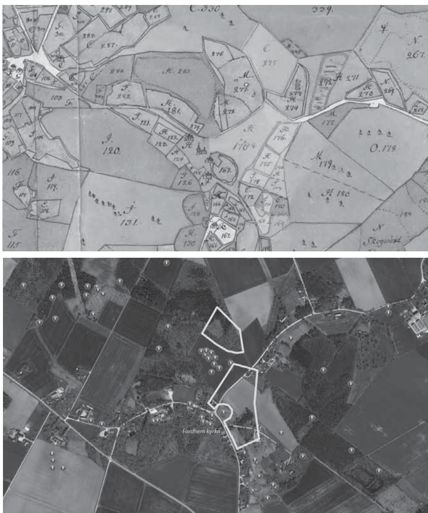
Figur 7a och b. På en höjdsträckning norr och nordöst om Fardhem kyrka finns på skattdokumenteringen Tingz-Ruhm, Tingzängen och Tingzkull åker. Ågorna var delade mellan fem gårdar, bland andra Prästgården. Här låg ett stort gravfält med rötter i bronsåldern, som det bara finns spillror kvar av idag. Dåvarande prästen uppgav år 1799 att han "upprivit många hedna rör och gravar, bortfört 1000:de tals lass sten till anlagde gärdsgårdar och där funnit de rör som haft över 800 lass sten i sig" (Östergren 2018, s. 51). Fardhem var en av Gutalagens tre asylkyrkor. Kartorna är hämtade ur Östergren 2018.

ägospplittring. Tinget tycks ha tagit förhållandevis stora ytor i anspråk. Kriterierna för de gotländska tingsplatserna är i stort sett desamma som för tingsplatserna i övriga Norden. Vid ett seminarium i Visby den