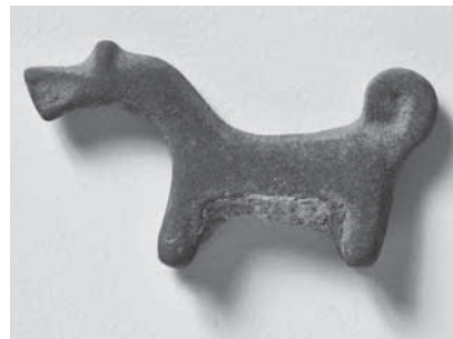
Figur 5a och b. Två djurformade viktlot som saknar paralleller på Gotland men som förekommer i Polen, Baltikum och Finland. Viktloten är 2–3 cm stora.

samlingsplats redan under äldre järnålder. Några ytterligare belägg för detta finns emellertid inte. Enligt numismatikern Lennart Lind kom denarerna till Sverige först på 300-talet (Lind 2018, s. 14).