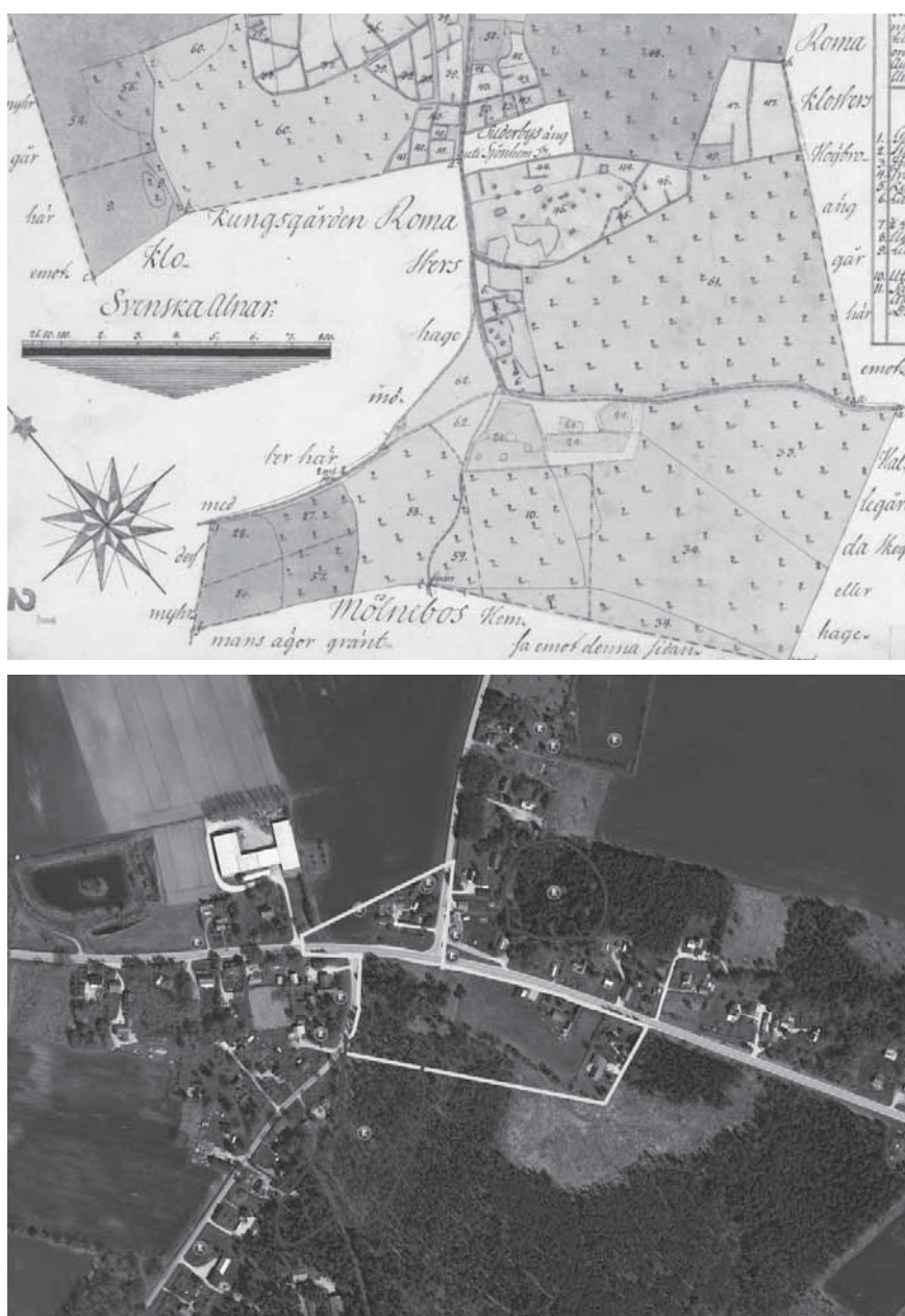
Figur 8a och b. På en storskifteskarta från 1795 över gården Broe i Halla socken finns Kuppe Tingsrum och Kuppe Tingsåkrar markerade. Ågorna ligger vid vägskälet mitt i det så kallade Broegravfältet i södra delen av Halla socken och sydöst om Roma samhälle. Namn som Rörhagen samt Lilla och Stora Röråkern norr om vägskälet antyder att gravfältet haft en betydligt större utbredning än vad som är känt idag. Att tingsnamnen inte finns angivna på skattningskartan kan förklaras med att denna karta sällan innehåller detaljer i perifera områden i socknarna. Kartorna är hämtade ur Östergren 2018.