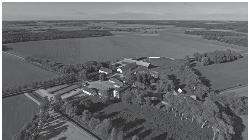
Figur 1. Gutnaltingets samlingsplats har sannolikt legat i den så kallade Guldäkern på höjdsträckningen norr om Roma kungsgård och klosterriuen. I bakgrunden den uppodlade före detta insjön Roma myr.