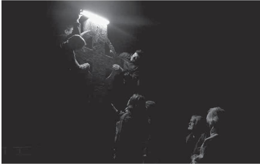
Figur 2. Släpljusundersökning av Grenskorset i samarbete med universitetet i York: Foto: Mästerbyprojektet.

Befolkningsmängden på Gotland under medeltid är inte känd. En uppskattning är att den totala mobiliseringsstyrkan i samband med den danska invasionen bör ha varit mellan 4 250 och 5 000 man, med tanke på att många stora gårdar kunde bidra med i genomsnitt fyra man (Westholm 2007, s. 133). Av dessa kan minst 500 man ha deltagit i striden på Fjäle myr. Det är inte heller känt hur många man den danska armén bestod av, men cirka 1500–2500 man är en trolig siffra i jämförelse med ungefärligen samtida krigståg. Den danska armén bestod till stor del av professionella tyska legosoldater (Hammarhjelm 1998, s. 70; Westholm 2007, s. 138 och där anförd litteratur).