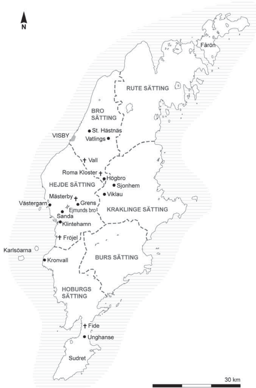
Figur 1. Det medeltida Gotlands indelning i settingar och ting. Efter Tortzen 1961.