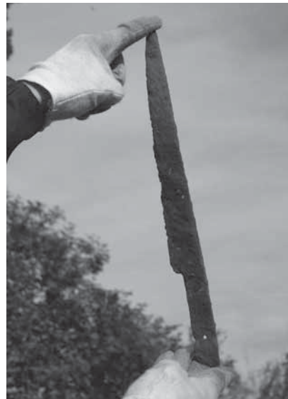
Figur 5. Stridskniv (F10) från 2006 års undersökning före konservering.

Den första fältveckan år 2006 resulterade i flera slagfältsrelaterade