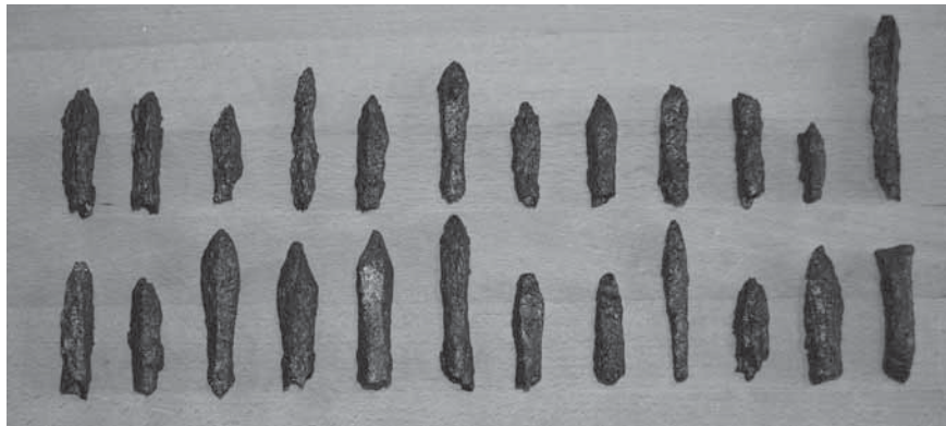
Figur 9. Armborstpilspetsar från 2018 års undersökning.

med Tyska Ordens invasion av ön år 1398 (Westholm 2007, s. 284).