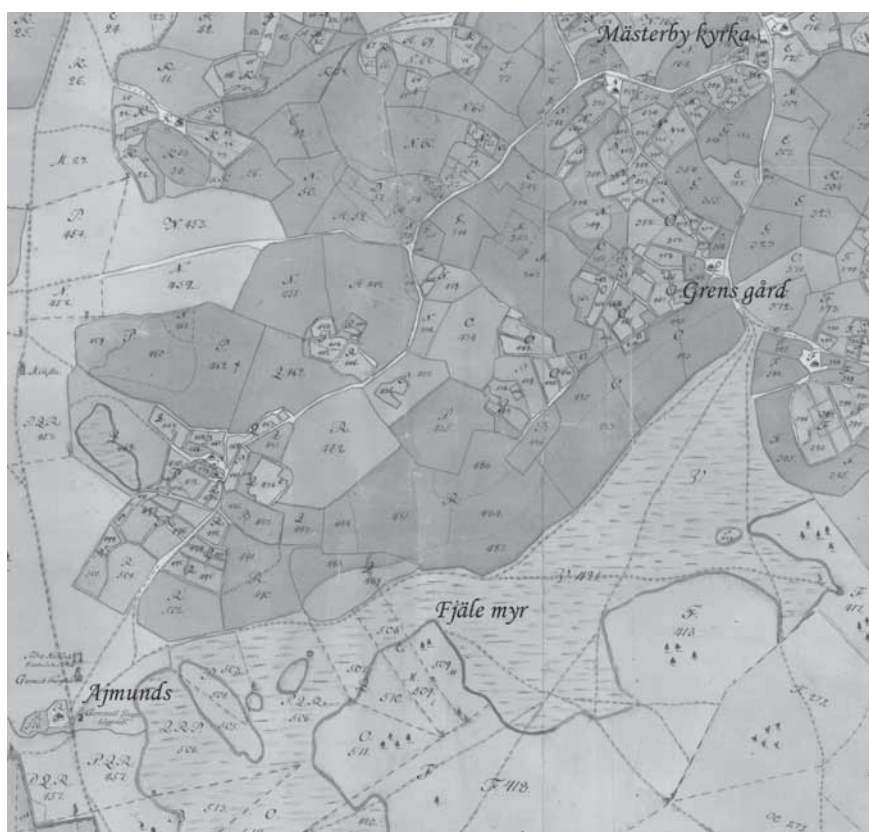
Figur 4. 1753 års konceptkarta över Mästerby socken. Kartan är något beskuren jämfört med originalet och platsnamn är tillagda.

Runt om i Europa har man i decennier letat efter medeltida slagfält, men genom att söka efter andra