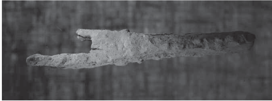
Figur 7. Parerstång till svärd (F8) från undersökning i augusti 2008.

ment, sex spjut- eller lansspetsar, 12 sporrar, nio mestadels små järnprojektiler, 20 små mestadels kvadratiska blyprojektiler, 10 ringbrynje-fragment samt armborstfragment, spetsar till spikklubbor, stridsknivar, pilspetsar och rustningsdetaljer i form av lameller, söljor och beslag samt enstaka fynd av personlig utrustning. Resultaten har redovisats i årsrapporter (Lingström 2007–2019, se www.masterby1361.se , samt www.samla.se ). Slagfältsfynden har paralleller till Korsbetningen, men kompletterar lika ofta detta material, inte minst när det gäller vapen. Inga vapenfynd har gjorts i gravarna i Visby. Mästerbyfynden utgör därmed en mycket viktig förståhandskälla till information om den danska invasionen år 1361. Sammantaget gör fynden och deras spridning att vi näst intill minut för minut kan följa striderna mellan gotlänningarna och den danska armén.