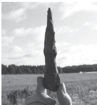
Figur 8. Spjutspets (F12) från 2009 års undersökning.

medan andra försvarare fick nöja sig med farfarsfars svärd och rustning. Det är en bild som även möter oss vid Korsbetningen, där vissa för tiden föråldrade rustningar tros härstamma från 1288 års inbördeskrig eller ännu tidigare, den äldsta med datering så långt tillbaka som till vikingatid (Westholm 2007, s. 249).