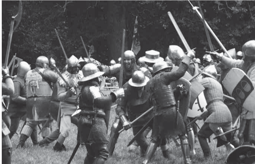
Figur 10. 2013 års reenactment i Mästerbyängen. Fyra reenactments har under åren 2011–2019 arrangerats. Flera hundra deltagare från upp till 20 länder, och en publik på upp till 2000 personer per gång visar på intresset för återskapandet av stridigheterna i Mästerby.

vi i myrens smalaste parti ser tecken både på distansstrid och närstrid: en distansstrid där gotlänningarna fattat posto norr om myren och danskarna anföll från området söder om myren. Gotlänningarna lyckades i detta skede pressa tillbaka den mindre styrka som danskarna först skickade ut på myren. Det är därför vi även ser tecken på närstrid, i form av delar av vapen, inom denna del av slagfältet. Då danskarna satte in hela sin styrka av yrkessoldater var dock gotlänningarna chanslösa. Danskarna tog sig över myren och ut på bredd. Sedan var utgången given och vägen mot Visby låg öppen.