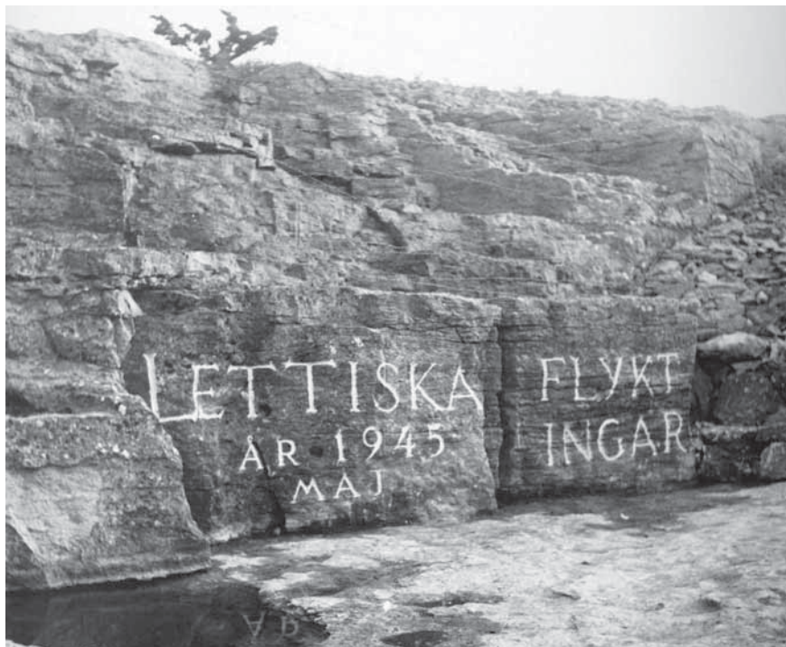
Figur 1. Den nyligen färdigställda ristningen med källan till vänster. På fotot anas flera taggträds- linjer.