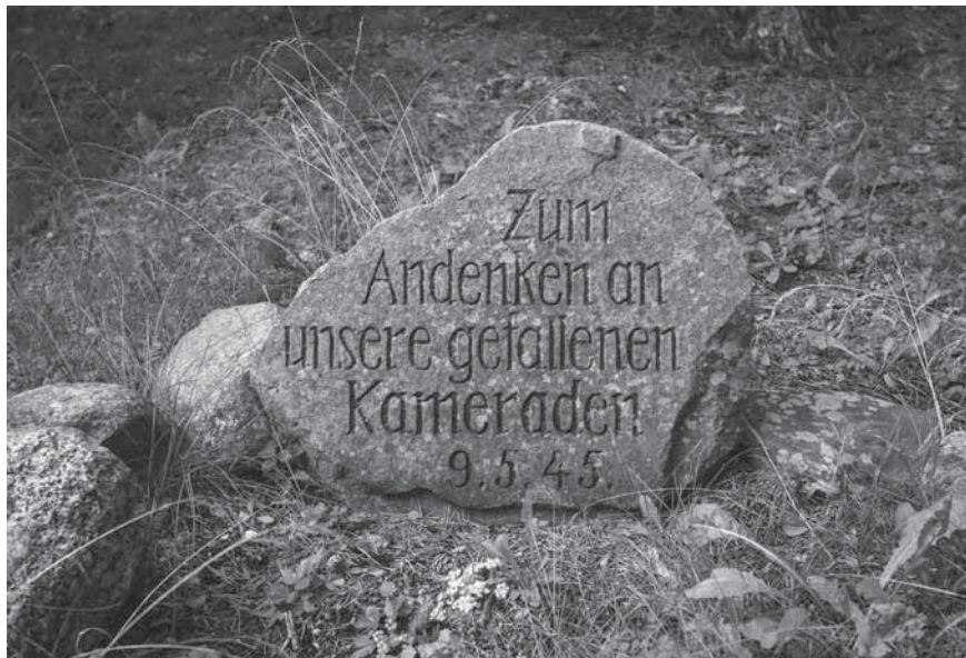
Figur 8. Minnesstenen i förläggningen Lager Lingen över de drygt 70 tyska soldater från Kurlandsarmén som dog under flykten till följd av beskjutning till sjöss.

Minnesstenen och sockeln i Lager Lingen är intressanta paralleller till Flyktingkällan, eftersom det rör sig om fasta monument, skapade för att uttrycka ett budskap men också för att inpränta ett minne i en plats. Sådana minnesmärken har sällan uppmärksammats inom forskningen om skyttegravskonst, men verkar vara en del av den materiella kultur som kan relateras till just lägerkontexter. Bland andra svenska exempel kan nämnas den så kallade ”Rysstenen” i Skinnskattebergs skogar, där ryska krigsfångar internerades i den slutna förläggningen Krampen under arbete med ett vägbygge såg till att rista in kommunistpartiets stjärna, en hammare och skära samt inskriptionen CCCP 1944 (Lihammer 2006). Ett annat fall finns i Vägershult i södra Småland, där tyska