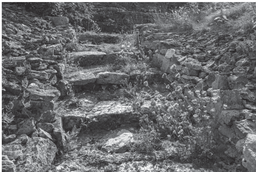
Figur 2. En stenlagd gång med trappsteg leder upp till minnesmärket.