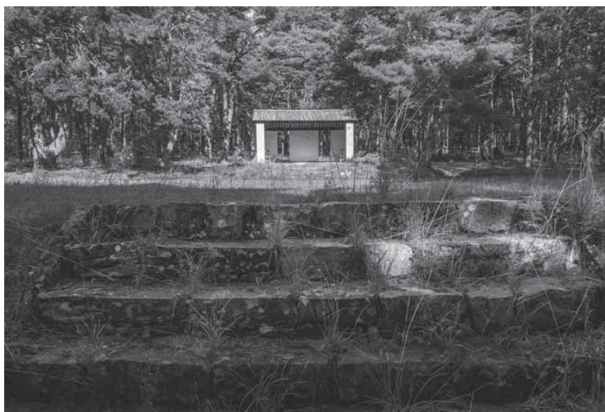
Figur 9. På platsen för Lager Lingen finns flera bevarade anläggningar skapade av de internerade, bland annat den scen där skådespel och musikunderhållning framfördes.

och österrikiska desertörer som tack till Sverige och till minne av sin interneringstid skapade ett tre meter högt monument i sten och betong med scener ur de internerades liv och med en stor staty av en internerad tysk som står på en brusten svastika (Johansson 2004).