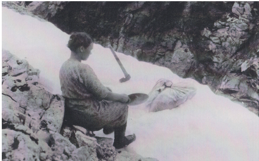
Figur 6. Mat som ska bevaras i snölega på sommaren.