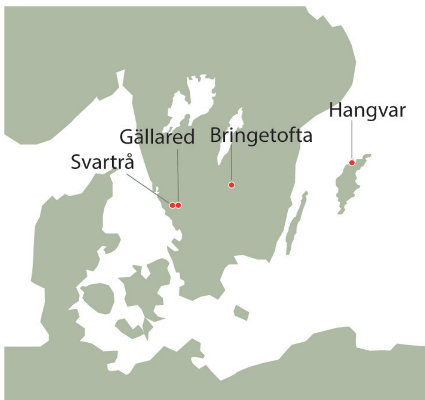
Figur 1. Karta med Gällared, Bringetofta, Hangvar och Svarträ kyrkor utmärkta. I de tre första kyrkorna har fosterbegravningar hittats och från Svarträ kyrka finns ett historiskt dokumenterat exempel på hur en hemlig fosterbegravning kunde gå till. (Karta: Anders Andersson, Kulturmiljö Halland).

I likhet med andra typer av efter- reformatiska gravar inne i kyrkor, kryptor och kapell har kategorin fosterbegravningar inte självklart klassats som en fornlämning, och det är långt ifrån givet att de un- dersöks av arkeologer. I vissa fall har kyrkans personal identifierat askarna som begravningar, och återbegravt dem på kyrkogården utan att kon- sultera museerna (Hagberg 1937, s. 510; Bø 1960). Fallstudierna som beskrivs i den här artikeln visar på värdet av noggranna undersökningar av fosterbegravningarna, men också