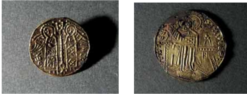
Figur 6 a, b. Två små broscher påträffade i Lund som återger myntbilder. Diameter för den mindre broschen är 26 mm. KM 53.436: 621 och 59. 126: 408. Foto: Kulturen, Lund. 2015.