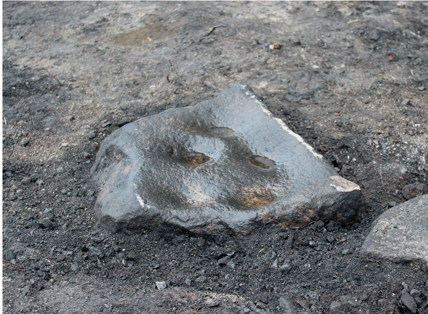
Bild 2. En av bokningsstenarna låg på hyttbacken, sannolikt på den plats där den använts.