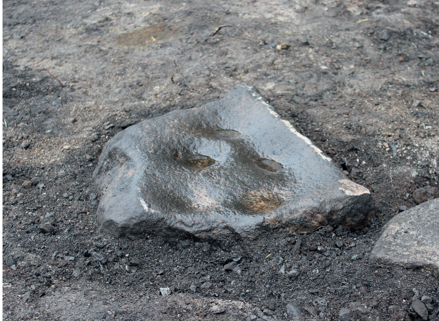
Bild 2. En av bokningsstenarna låg på hyttbacken, sannolikt på den plats där den använts.