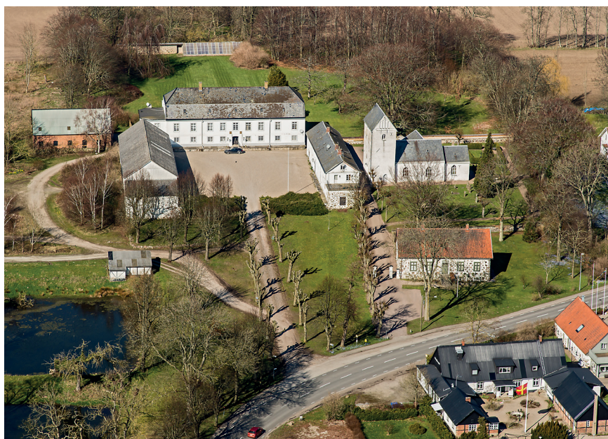
Fig. 5. Stora Herrestad kyrka med ett gårdskomplex i väster. Det såg kanske inte så ut exakt så här på medeltiden men sätesgården från 1700-talet antas ha en medeltida föregångare. Intressant är hur längorna orienterar sig mot varandra, inte mot kyrkan som fallet är i Dalby.

hem medan en stenkällare intill S:t Jørgensbjerg i Roskilde ses som en stormansgård i stället för ett kloster, trots att ett sådant nämns i skriftliga källor (Stiesdal 1980, s. 167; Andersen & Nielsen 2000, s. 121–143; jmf. Nyborg 2004, s. 127; Wienberg 2010, s. 22). Återigen försvinner de alternativa tolkningarna i en diskurs som fokuserar på den världsliga makten.