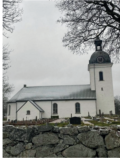
Fig. 1: Åseda kyrka, bild tagen från norr. Foto: Elias Engdahl, december 2022.

Liepe och Ullén har genom detta arbete bidragit med relevans och förståelse av de arkeologiska fynd som har gjorts i Åseda kyrka. Där- emot har föremålen inte diskuterats i någon vidare grad mer än deras datering. Syftet med denna artikel är därför att undersöka och tolka de bemålade bitarna av fönsterglas, mynten och en specifik murad konstruktion under koret. Hur reflekterar dessa arkeologiska fynd Åseda socken under medeltiden? Bör dateringen av dessa föremål användas som en motpol för dateringen av sal-