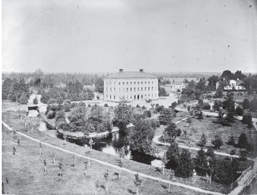
Figur 1. Mitt i bilden syns den nyuppförda huvudbyggnaden "Slottet", till höger skimtar den gamla herrgårdsbyggnaden. Den engelska parken är nyanlagd med nyplanterade träd, grusade gångvägar, vattenspeglar och vattenfall. Foto från år 1877, Jernkontoret.

(1998:808). Syftet med reservatsbildningen är att kunna skydda, bevara och vårda kulturhistoriskt värdefulla landskap, vilket även omfattar områden med äldre industriell verksamhet.