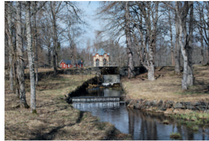
Figur 2. Vattenfallet från Sågdammen till Skolån. I bakgrunden syns lusthuset.

annat karuseller, gungor och kägellbanor kunde förekomma (Nolin 2023:41). Det finns också uppgifter om att det funnits en kägellbana vid Axmar bruk (SE/NIN/62:1) men var den legat är ännu oklart.