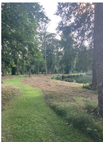
Figur 10. I den engelska parken markeras de arkeologiskt belagda gångvägarna genom gräsklippning.

vinbär, krusbär och hallon har flyttats samman till den västra delen av trädgården. Häcken, som avgränsar trädgården i öster, har kompletterats med nya växter.