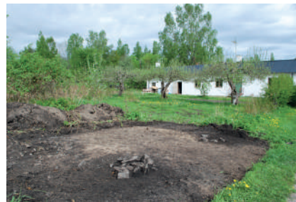
Figur 5. Entrégången till växthusträdgården där stenskodda stolphål visar var grinden varit. I bakgrunden syns växthusbyggnaden med de framförvarande äppelträden som planterades när trädgården anlades.

De övriga gångarna har varit 1,2 meter breda, motsvarande ungefär två alnar. Eftersom trädgården har brukats under lång tid, då gångvägarna underhållits och förnyats, har det ibland varit svårt att bestämma den exakta bredden. I västra delen av trädgården hittades gångvägar som inte finns markerade i det historiska kartmaterialet och som utgör ett yngre skede i trädgården.