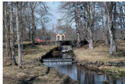
Figur 2. Vattenfallet från Sågdammen till Skolån. I bakgrunden syns lusthuset.

annat karuseller, gungor och kägellbanor kunde förekomma (Nolin 2023:41). Det finns också uppgifter om att det funnits en kägellbana vid Axmar bruk (SE/NIN/62:1) men var den legat är ännu oklart.