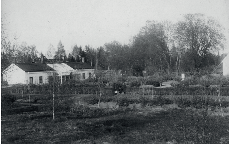
Figur 3. Den nyplanterade trädgården framför växthuset med häckar, unga träd och bärbuskar. Foto troligen från år 1879, Söderhamns kommunarkiv.

av växthuset har sannolikt rivits i slutet av 1930-talet. När skötseln av parken och dess gångsystem upphörde vet vi däremot inte.