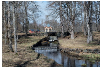
Figur 2. Vattenfallet från Sågdammen till Skolån. I bakgrunden syns lusthuset.

annat karuseller, gungor och kägelnor kunde förekomma (Nolin 2023:41). Det finns också uppgifter om att det funnits en kägelnor vid Axmar bruk (SE/NIN/62:1) men var den legat är ännu oklart.