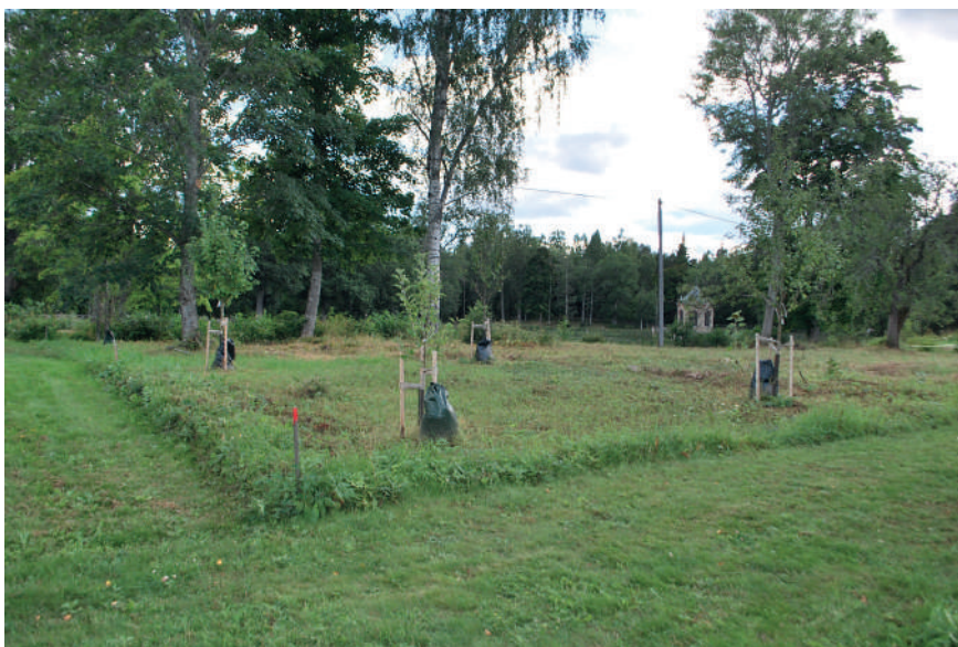
Figur 9. I hörnen av de historiska odlingsbäddarna i växthusträdgården har äppelträd planterats. Därmed tydliggörs trädgårdens ursprungliga struktur.