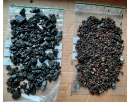
Figur 8. Grusprover från gångvägarnas beläggning i engelska parken. Proverna tvättades i fält. Till vänster i bild ett gulrött morängrus och till höger ett grövre gråsvart skiffergrus.

nas skiffer kommer därifrån. Till skillnad mot skiffergruset kommer det gulröda gruset sannolikt från lokala täkter (Blennå & Lindeblad 2022a:18). Intressant är att även om gruset i både växthusträdgården och engelska parken kommer från lokala förekomster så har de ändå hämtats från olika platser. Kanske visar det skillnaden i status mellan nyttotradgården och lustparken.