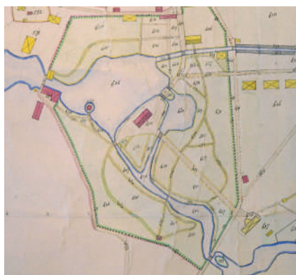
Figur 4. Inäggkarta över Axmar bruk år 1883 (beskuren).

gård, stenig trädgård och potatisland. Uttrycket ”stenig trädgård” innebar att den delen var avsedd för fruktträd (Flinck m.fl. 2017:12). Ordet krydda hade tidigare en bredare betydelse än idag, både kryddgård och kålgård användes många gånger synonymt och kunde då vara detsamma som köksväxtland (Hallgren 2016:181). Benämningen och därmed betydelsen av olika trädgårdstyper har växlat över tid (Flinck m.fl. 2017:12). Uppgifterna i det historiska kartmaterialet kan ha varierat beroende på lantmäteriinstruktionerna och i vilken skala kartan skulle framställas, men även på grund av lantmätarens personliga stil (Hallgren 2016:103). Kartan från 1883 visar växthuset med framföriggande trädgård uppdelad i fem kvarter omgivna av gångvägar med en bredare mittgång som löpte mellan byggnaden och kanalen. I kartbilden syns också den stora förändring som skett inom området för det tidigare hyttområde och parkens system av gångvägar.