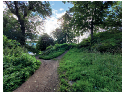
Figur 5. Trädgården på Stora Katrinelund. Miljön med slingrande gångar och växtlighet kan påminna om den äldre trädgården, men har förändrats påtagligt under 1900-talet.

alltså sådant att vi vet betydligt mer om byggnaderna, särskilt mangårdsbyggnaderna, än om de park- och trädgårdsmiljöer som omgav dem (Fischer 1923; Kulturmiljövision).