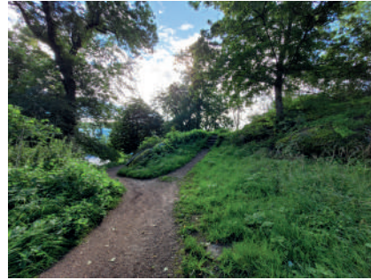
Figur 5. Trädgården på Stora Katrinelund. Miljön med slingrande gångar och växtlighet kan påminna om den äldre trädgården, men har förändrats påtagligt under 1900-talet.

alltså sådant att vi vet betydligt mer om byggnaderna, särskilt mangårdsbyggnaderna, än om de park- och trädgårdsmiljöer som omgav dem (Fischer 1923; Kulturmiljövision).