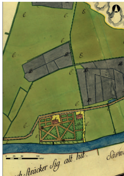
Figur 8. Gamlestadens landeri 1769. Karta: Lantmäteriet N31-1:12.

figur 8). Det innehades då av superkargören i Ostindiska kompaniet Christian Tham. Mangårdsbyggnaden och en trädgård låg omedelbart norr om Säveån. Trädgården var "anlagd i figur av St. Andreae Orden" med två större bäddar med korsformade gångar och en rak siktlinje ned mot ån. Mot Säveån fanns en terrasskant med mur och trappa ned mot ån. Inom landeriets område fanns också en krog "som trädgårdsmästaren mot arrende nyttjar" och ett torp, vars åbo gjorde dagsverken på gården. Fischer (1923:49) menar att planen tillkommit då Tham tillträdde landeriet 1760. Detta bekräftas av texten på kartan som anger att landeriet främst hade använts till betesmark före 1760.