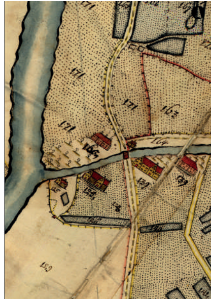
Figur 7. Marieholm (nr 165) på kartan 1696.

I samband med de arkeologiska undersökningarna av Nya Lödöse