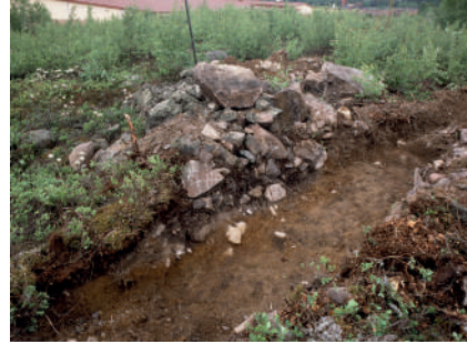
Figur 3. Odlingssytan med tillhörande stenvall. Foto från nordnordväst. Fotograf: Anna Lögdqvist, Dalarnas museum, DM_2005 18_10 5.

Platsens läge gör den intressant att studera dels ur gruvans perspektiv, dels utifrån Falu stadsbildnings perspektiv. Undersökningen berörde de sydvästra delarna av Falun L2001:4194 och de nordvästra delarna av Falun L2001:4261 registrerade (KMR) som bytomt/gårdstomt. Förundersökningen innefattade både inventering och en sökschaktsgrävning. Sammanlagt påträffades trettiofem lämningar av varierande ålder, bland