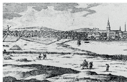
Figur 5. Illustration av staden Falu under andra halvan av 1600-talet. Till höger ligger sjön Tisken, till vänster ett inhägnat odlingsområde (Daglöstakten). I bakgrunden ligger staden. (Kungliga biblioteket (online), Erik Dahlberghs Suecia antiqua et hodierna 1660–1696.

I Erik Dahlberghs Suecia antiqua et hodierna från år 1660–1696 (KB) finns ett kopparstick över Falu stad där man i bakgrunden ser odlingsjord söder om kvarteret Västra Falun. På 1761 års stadskarta som upprättades efter stadsbranden, finns samma kålgårdsområde utmarkerat strax sydost om kvarteret, då benämnt som Daglöstakten. Förklaringen till namnet Daglösa varierar från brist på dagsljus, till Dagfinns äng (Hemström 1991). Dahlberghs skildring över Falu stad är på många