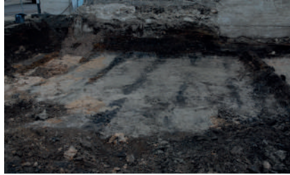
Figur 4. De mörka linjerna som kan vara spår från att man har kupert jord och planterat grödor som odlats på rad. I fält tolkades de vara dräneringsdiken. Foto från väst. Fotograf: Eva Carlsson, Dalarnas museum, DM_2013 29_5 30.

vid en annan undersökning påträffades spår efter möjliga odlingsbäddar, som i fält tolkades vara dräneringsdiken. Analysen påvisade en blandning av växter som indikerade både våt- och torrmark samt latrinmaterial. Närvaron av odlade växter även i pollenmaterialet sammantaget med en dominans av gräs och åkerogräs indikerar att odling möjligtvis skett i närheten av området (Wehlin 2020:43–45).