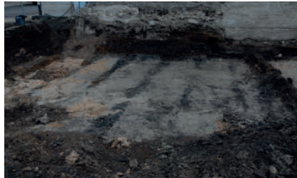
Figur 4. De mörka linjerna som kan vara spår från att man har kupat jord och planterat grödor som odlats på rad. I fält tolkades de vara dräneringsdiken. Foto från väst. Fotograf: Eva Carlsson, Dalarnas museum, DM_2013 29_5 30.

vid en annan undersökning påträffades spår efter möjliga odlingsbäddar, som i fält tolkades vara dräneringsdiken. Analysen påvisade en blandning av växter som indikerade både våt- och torrmark samt latrinmaterial. Närvaron av odlade växter även i pollenmaterialet sammantaget med en dominans av gräs och åkerogräs indikerar att odling möjligtvis skett i närheten av området (Wehlin 2020:43–45).