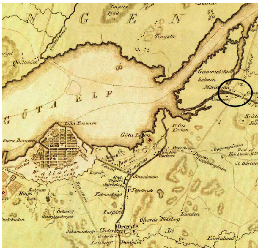
Figur 1. Karta med nuvarande centrala Göteborg i väster och Nya Lödöse i öster (markerad med ring). Utsnitt ur kartan "Belägenheten omkring Göteborg 1809" utgiven av N.G. Werming (Riksarkivet SE/KrA/0431/009).

m.fl. 2021). Trots detta påträffades fröer och växtdelar i olika brukade lager och gropar inne på stadsgårdarna som visar att många hushåll hade tillgång till såväl kålgårdar som åkermark.