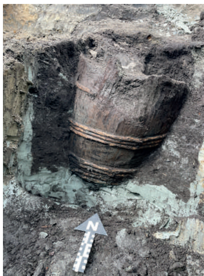
Figur 5. Nedgrävd tunna från stadens sista år under 1600-talet. I den fanns avfall från odling. I botten fanns en spade nedstucken i den naturliga leran. Foto från söder Veronica Forsblom Ljungdahl.

Spår av odling fanns även i några konstruktioner inom ytan. Från sent 1400 eller tidigt 1500-tal fanns en stor avfallsgrop nära de odlade ytorna. I den fanns dynga och möjligen latrin, den hade även tecken på att vatten hade stått i den. Från 1600-talet fanns en nedgrävd tunna fylld med odlingsavfall (figur 5). Däremot har ingen brunn påträffats inom den undersökta ytan.