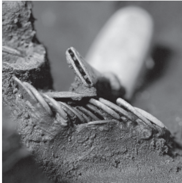
Fig 1. Denarer fra Illerup-fundet in situ. Efter Horsnæs 2003.

Punge med mønter kender vi også fra krigsbytteofferfundet i Illerup Ådal nær Århus hvis nedlæggelse er dendrokronologisk dateret i begyndelsen af 200-tallet e.Kr. Det store offerfund omfatter bl.a. ca. 200 romerske mønter, som er fundet i små portioner, der er knyttet til punge. I mange tilfælde indeholdt pungen kun en enkelt mønt. Pungene indeholdt desuden en kam og et ildstål. Der er tydeligvis tale om krigerens personlige ejendele.