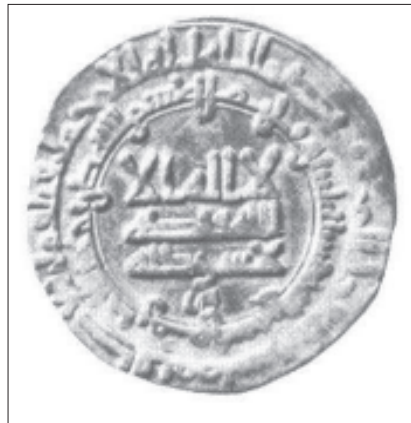
Figur 1. Dirhem präglad av den samanidiske härskaren Nasr ibn Achmad i Samarkand år 914/115. Fynd från Häffinds (II), Burs sn, Gotland, CNS I.2.29.703. Ø 2,73 cm.

utan främst materiella uttryck för statligt organiserade samhällen. Här finns en välkomponerad uppsättning av meningar som framhäver myntherrarnas världsbild och självförståelse och idéer om standard och auktoritet.