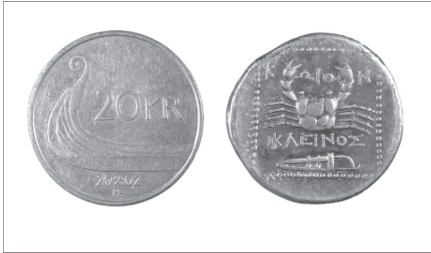
Fig 2. Bruksjenstand eller politisk symbol? Dagens norske 20-krone viser et nasjonalklenodium; den hellenistiske tetradrakmen fra øya Kos viser byens parasemon: et ordinært sjødyr. Hva er mest politisk og symbolsk ladet?