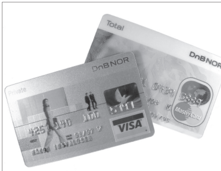
Fig 1. Samme funksjon, samme kreditt, samme person - men ulik sosial verdi.