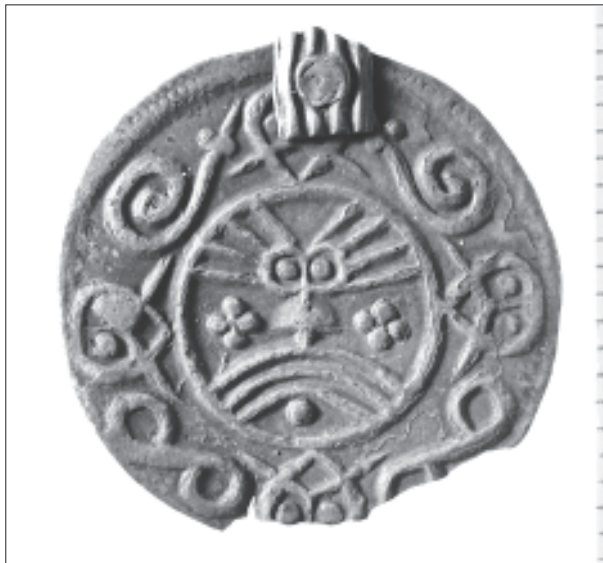
Figur 2. Nordiskt 800-tals mynt från Birka, grav 508. SHM utan nr.