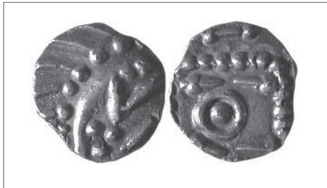
Figur 3. Sceatta präglad i början av 700-talet, s.k. porcupine typ. Frisland. Ø 1,1 cm.

alls motsvarar den mängd som form-ligen översvämmar de många utbytes-platserna på båda sidor om den engelska kanalen under första hälften av 700-talet (Blackburn 2003).