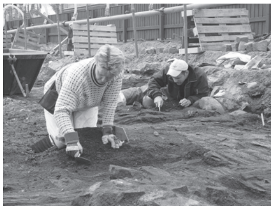
Figur 4. Ett farligt arbete?

arkeologiska informationsvärdet att göra. Man kan t.ex. behöva en lämplig uppställningsplats för bodar, en permanent körväg för maskinerna eller ett upplag för schaktmassor. På samma sätt bör man betrakta en kontaminerad yta; som likställd med en större störning man undviker att gräva i eller bara dokumenterar översiktligt.