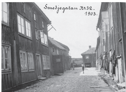
Figur 2. Gårdsinteriör från Smedjegatan 32 med verkstad och stall. Foto 1903.

Sentida nedgrävningar för grunder och pålningar fungerade i flera fall som dräneringar för vattenburna eller flytande föroreningar vilka leddes ner i mer genomsläppliga lager. Här kunde ett på ytan till synes begränsat utsläpp plötsligt visa sig ha mycket större utbredning på djupare nivåer. Ett annat problem utgjordes av de ledningar som lett bort dagvatten från parkeringsplatsen, vatten som smutsats av läckande bilar sedan mitten av 1950-talet.