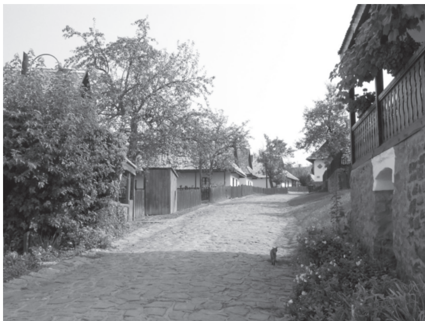
Fig. 1. Världskulturarv i Ungern - bygatan i Hollókő. Byn upptogs på UNESCO:s världsarvslista år 1987.

lag ett starkt exploateringsstryck, något som också gäller medeltida och eftermedeltida lämningar. Den som är intresserad av ungersk medeltidsarkeologi, avseende såväl dess ämneshistorik som dess situation idag, rekommenderas att läsa valda delar ur Hungarian Archaeology at the Turn of the Millenium , en utförlig Stand der Dinge -publikation utgiven år 2003 (Bartosiewicz et al 2003).