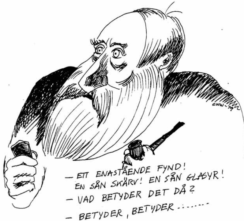
Figur 1: "Betyder, betyder..." Tegning i META 1979 nr. 1 av Claes Wahlöö

Hvilken betydning har et funn? Og hva betyr det at arkeologisk kunnskap skal være samfunnsrelevant? Slike og lignende spørsmål var den første META-redaksjonen opptatt av, og vi ville gjøre noe mer med det enn å la diskusjonen begrense seg til deltakerne rundt lunsjbordet i Krafts Torg 4. Vi opplevde disse spørsmålene av grunnleggende betydning for hvordan middelalderarkeologien ble drevet i felt og bak skrivebordet, for det var middelalderarkeologiens ve og vel, dens innhold, praksis, seriøsitet, aksept og innflytelse det hele handlet om. META skulle være et verktøy for å fremme dette målet gjennom å tilby