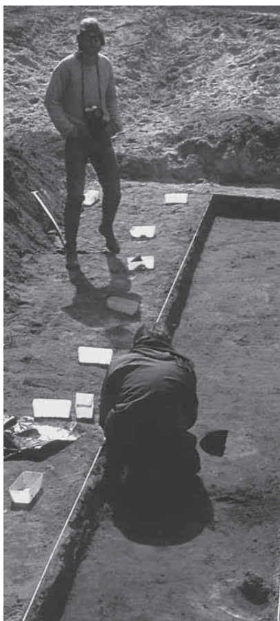
Figur 4: Fra en gravning i Falsterbo, mai 1976. Prøvesjakter, dokumentasjon av horisontal stratigrafi og funnnummer relatert til lag var rutiner på gang.

forsøk på å a) beskrive og begrunne et nytt teoretisk praksisbehov innen middelalderarkeologien, b) som en begrunnelse for hvorfor ønsket om å etablere en ny forskningspraksis vokste fram akkurat der og da, og endelig c) hva som påvirket utformingen av en slik ny praksis.