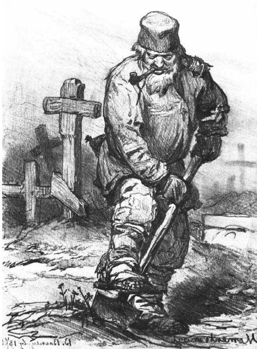
Figur 2. Hur grävdes graven och av vem/vilka? Målning från 1871 av Viktor Vasnetsov. Från Wikimedia Commons ( http://commons.wikimedia.org/wiki/File:Vasnetsov_Grave_digger.JPG ).