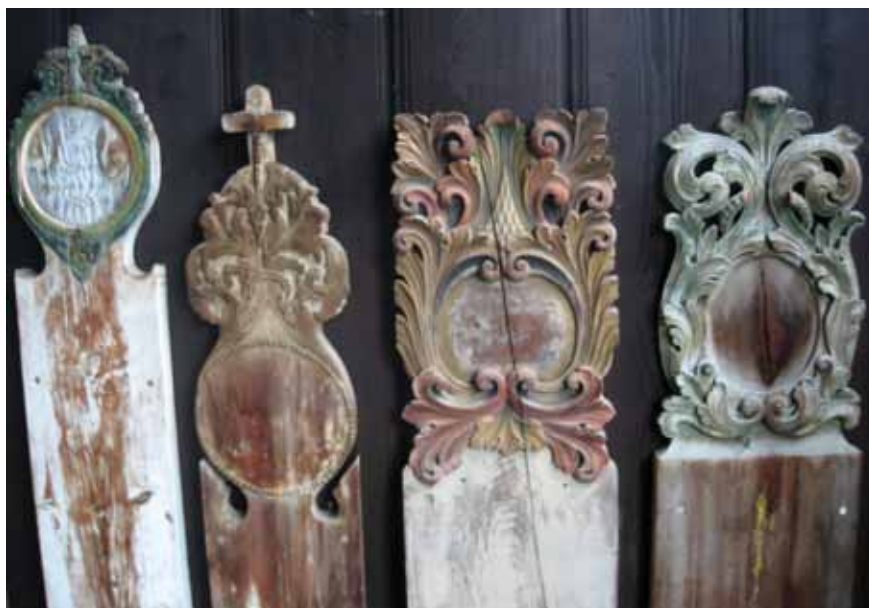
Figur 4. Gravmarkörer i trä från Heidal kyrka i Oppland, Norge.

har det i alla tider fungerat mer eller mindre som idag; att en grav fick ligga ostörd så länge någon tog ansvar för dess skötsel (och betalade?). Ur en arkeologisk synvinkel är det därför av intresse att se om man kan finna spår efter vad som kan vara restaureringsarbeten: har man bytt ut eller förstärkt gravmarkeringar? Har man påfört ny jord över gravfyllningen? Kan sociala skillnader spåras, verkar det framför allt vara vissa grupper som har haft resurser för att värna om sina döda släktingars gravar?