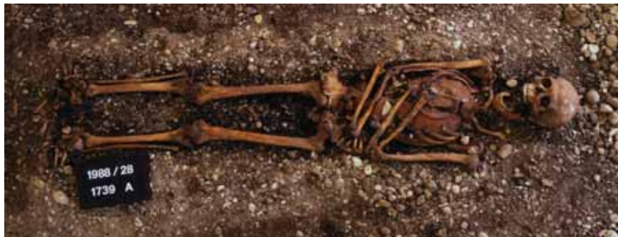
Figur 3. Bilden visar en grav från 1853 undersökt på Spitalfriedhof St. Johann i Basel. Den gravlagde mannen har en tallrik under bröstbenet och revbenen. Möjligen ett illustrativt exempel på hur förmultningsprocessen kan påverka placeringen av föremål i en grav. Åtminstone har författaren av denna artikel svårt att komma med andra alternativ.

Återfyllning av graven: Gravfyllningen är en relativt negligerad enhet vid undersökning av gravar, men den kan ha potentialen att vara mycket mer än bara just en enhet. När en gravnedgrävning har lokaliserats hamnar fokus lätt på att så snabbt och enkelt som möjligt ta sig ner till "graven", och man glömmar att även återfyllningen har varit en