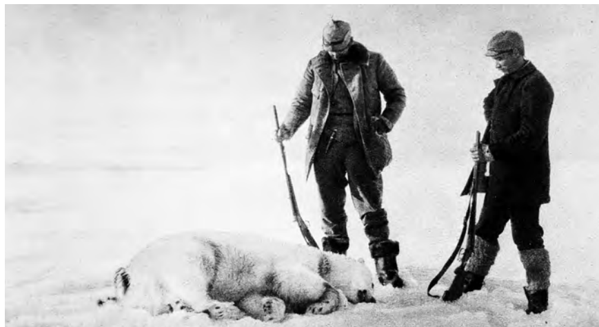
Figur 3. Knut Frænkel och Nils Strindberg poserar vid en skjuten isbjörn. Andrée kallade isbjörnar för "vandrande köttbodur" och underskattade antagligen riskerna med att ständigt ha djuren i närheten.

Någon definitiv lösning på dödsfallen gavs inte i "Med Örnen mot polen". Men det framhölls ändå starkt att bristen på varma kläder varit expeditionens svagaste punkt. Att männen frusit ihjäl var den troligaste förklaringen, hette det. (Andrée m.fl. 1930, s. 238ff.) Förklaringen var klar och lättbegriplig men framstod ändå som föga övertygande. Någon sträng vinterkyla hade ännu inte satt in vid tidpunkten, början av oktober. Många tidigare polarfarare hade överlevt nödtvungna övervintringar vid betydligt lägre temperaturer och mycket sämre utrustade.