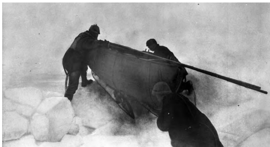
Figur 2. De tre människors slädvandring över den upptornade och sönderbrutna packisen blev krävande. Målet kom heller inte närmare eftersom isen drev åt motsatt håll.

Var då färden utsiktslös? Sedan expeditionen försvunnit fick de som varit skeptiska vatten på sin kvarn. Ballongernas epok var också snart förbi, de följdes som färdmedel av styrbara luftskepp och flygplan. Men drygt 100 år efter Andrée lyckades britten David Hempleman-Adams verkligen med bedriften att nå nordpolen med ballong. Hans farkost var fylld med helium och han höll sig också högt ovan molnen och slapp därmed de fuktproblem som Örnen råkade ut för. Hempleman-Adams styrde genom att reglera sin position i höjded efter var de gynnsammaste vindarna fanns. Han fick löpande instruktioner per radio och satellittelefon från väderexpertis. ”Marginalen mellan framgång och misslyckande är hårfin. Andrée skulle mycket väl ha kunnat lyckas om han bara haft en bråkdel av den meteorologiska information som jag hade tillgång