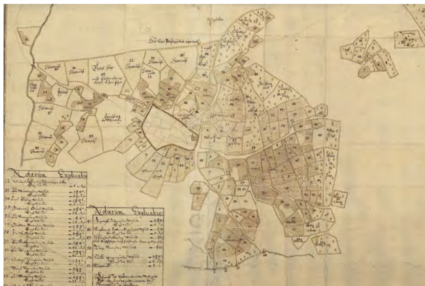
Figur 2. Geometrisk delineation över Vimmerby 1648, som visar stadsplanen med kyrkan i öster och torget i centralt placerat i staden.

Den ska då ha varit av timmer och ha legat strax väster om nuvarande kyrka. Några andra medeltida institutioner bortsett från kyrkan fanns troligen inte i staden (Åhman 1984, s. 13). Hade inte det skriftliga källmaterialet om Vimmerbys medeltid varit bevarat hade orten utifrån de materiella lämningarna aldrig kunnat påvisas som stad. Visserligen konstateras det ofta i de undersökningar som gjorts i Vimmerby att äldre kulturlager varit sönderschaktade, men hade det funnits en omfattande tät medeltida bebyggelse på platsen borde man i alla fall ha hittat några fler lösfynd av medeltida karaktär.