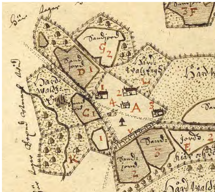
Figur 4. Utsnitt ur Geometrisk ägoavmätning över gården Torget 1645 som visar marknadsbodnar (v) och tingsstuga (4). Johan Larsson Grot, Lantmäteristyrelsens arkiv E123-50:e4:6-7 26.

landa kyrkby där ett nytt tingshus byggdes. På 1560-talet fick Vetlanda också en gästgivaregård och år 1586 anges marknaden i Vetlanda vara en enskild marknad för Eksjös borgare (Larsson 1995, s. 57).