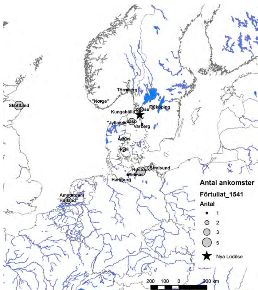
Figur 4. Kartan visar de orter som nämns i Nya Lödöses tullängd 1541 och antalet ankomster från respektive ort.

tande privilegier här. En del av handeln mellan den svenska kronan och de holländska köpmännen gick denna väg, även om mycket fortfarande också fördes via Nya Lödöse. Karl IX:s Göteborg brändes under Kalmarkriget och återuppbyggdes aldrig (Scander 1975).