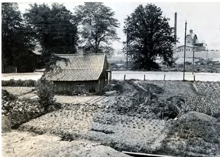
Figur 2. Gamlestaden var fortfarande ett mycket lantligt område i början av 1900-talet. Fotot är taget av Sixten Strömbom 1918 och visar "kyrkogårdsschaktet". I bakgrunden ser vi Marieholm och Slakthuset. Foto i GSM:s arkiv.

tomterna (Öbrink & Rosén in press). Några borgare tycks ha stannat kvar för att bevaka sina intressen och sina förråd. Under Kalmarkriget 1611–1613 blev själva staden tidvis ett slagfält och mer än hälften av borgarna flydde eller flyttade. Först 1619, då den andra Älvsborgs lösen hade erlagts och staden åter kom under svensk överhöghet, flyttade folk på allvar tillbaka till staden. Men under tiden hade Gustav II Adolf börjat smida planer på en ny stad, en stark fästning för den militära stormakten och samtidigt en plats dit främmande köpmän kunde lockas att etablera sig. Särskilt holländska handelsmän, med sina omfattande kontaktnät i hela den kända världen, var önskvärda. Från Nederländerna lockades också