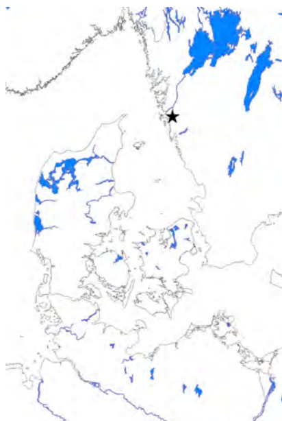
Figur 1. Platsen för Nya Lödöse i ett sydskandinaviskt sammanhang.

av en hamn och en kontrollpunkt närmare havet, liksom en önskan om att slippa betala tull vid Bohus fästning, har framförts som några av orsakerna till att staden grundades här 1473. De komplicerade maktrelationerna i området under Kalmarunionen och de oklara gränsdragningarna mellan de svenska, norska och danska rikena har sannolikt också varit betydelsefulla faktorer (Harlitz 2010). Stadsgrundaren var riksföreståndaren Sten Sture d.ä. Platsen som valdes ut ligger där Göta Älv och Sävån möts, således längs flera transportleder i olika väderstreck: mot det inre av Västergötland, norrut mot Värmland och kontaktnätet via Väneren, och västerut mot Atlanten och de europeiska handelsrutterna. Via Öresund nåddes de nordtyska och baltiska