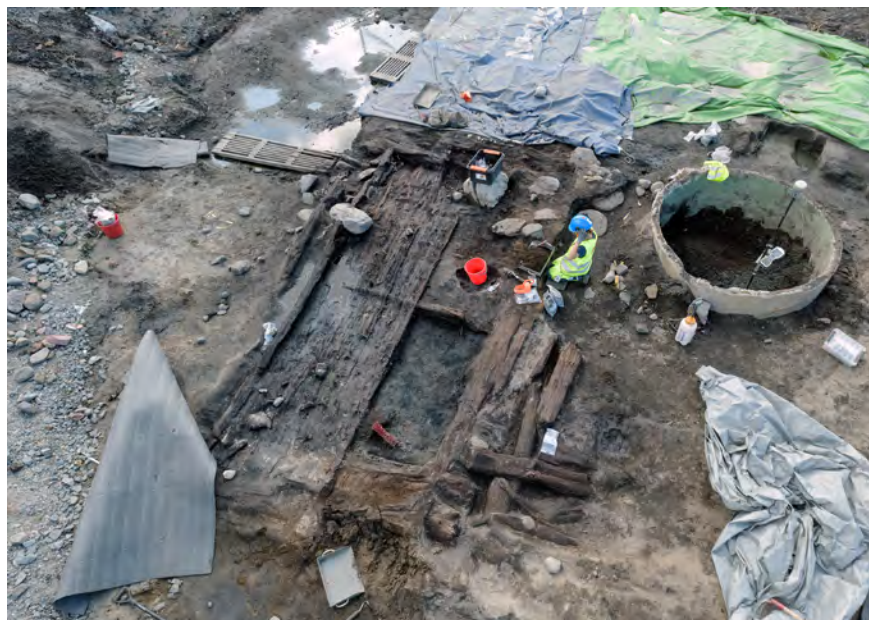
Figur 3. En av stadsgårdarna under utgrävning sommaren 2015.

Till skillnad från det arkeologiska materialet, som åtminstone på en generell nivå ger intryck av ganska stora likheter mellan stadsgårdarna, visar taxeringslängderna att det var mycket stora ekonomiska skillnader mellan borgarna. Bland de mest förmögna i staden fanns flera inflyttade borgare från tyska och holländska områden, men också en del svenska