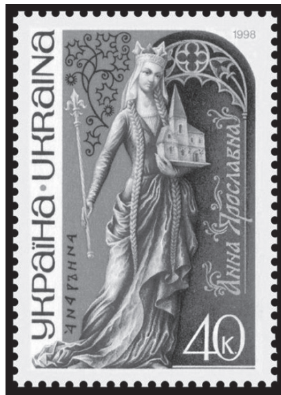
Figur 5. Anna på ett frimärke från Ukraina. Staven kröns av en fransk lilja och i famnen håller hon den kyrka i Senlis i Frankrike som förknippas med hennes namn och gärning.

personer. Att krönikornas förnäma kvinnor omnämns som fromma och dygdiga hör till mönstret och här är Anna Jaroslavna inget undantag. Gudsfruktan hade hon sig säkert lärt sig redan i barndomen i Kiev. Intressant är hur hon förfogade över de egna domäner som hon fått i morgongåva vid giftermålet med Henrik. Senlis några mil norr om Paris hörde till dessa. Där lät hon 1069 grunda ett kloster. Området gränsade för övrigt mot andre marken Raouls domän Crépy. På platsen fanns redan en kyrka, vigd åt S:t Vincent. Den var förfallen men hon lät restaurera den för sin far Jaroslavs och förste make Henriks själars skull. Klosterväsendet där gjorde visserligen franska revolutionen slut på men kort därefter återuppstod