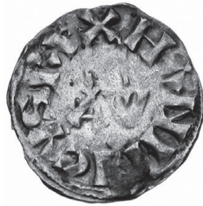
Figur 3. Mynt slaget för Annas gemål, Henrik I, i Paris. Inskription HANIRICVS REX. I mittfältet hängande alfa och omega (s. k. pendilia), en Kristusymbol.

Som en parallell till Ingegerdsringen från Sigtuna förekommer i källorna en ring som eftervärlden förknipat med Anna Jaroslavna. Det omnämns nämligen att den dåvarande kungen Ludvig VI år 1137 donerade en ring med en ovanlig ädelsten, en brandgul, genomskinlig så kall-