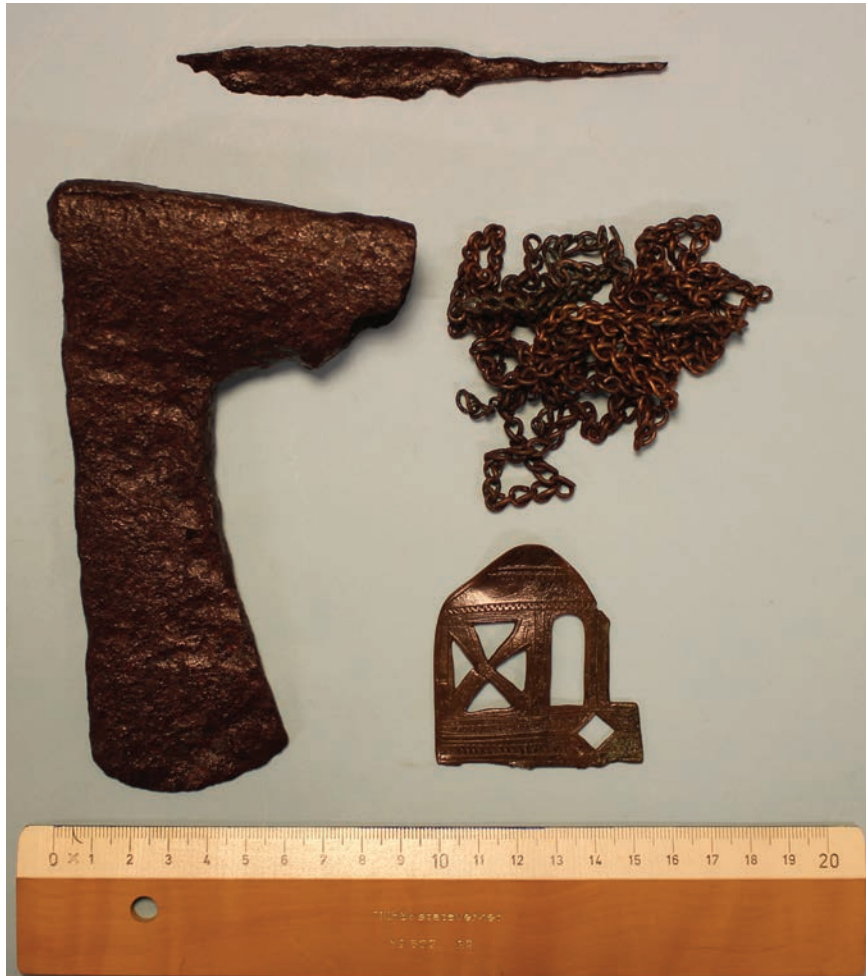
Figur 6. Samtliga föremål som påträffades i graven. Vad mässingsplåten ursprungligen varit är okänt. Nederkanten ser ut att ha brytmärken.

under en berghammer. Mellem de større stene, som omgav rummet, var der kilet ind mindre, og det hele var dækket av flate heller.” På mer än ett sätt ganska likt graven i Gransjön. Att graven från Mösjöen är intressant för Petersens artikel om björnkult är just mässingringen som fanns i graven. 1937 hade Petersen fått sig tillsänt ett björnkranium med en mässingkedja lindad runt kindbenet (Petersen 1940, s.