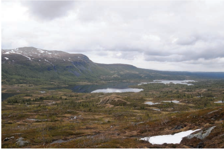
Figur 3. Offerplatsen ligger vid toppen av bergknallen och graven i ett stenskravel på den sida som vätter bort från sjön och vistena. Foto förf.