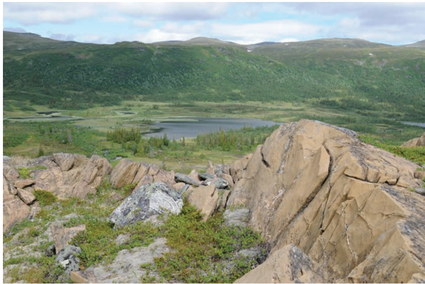
Figur 4. Från offerplatsen har man utsikt över sjön och dalgången med sina visten och renvallar.

samma bergknalle som graven. Till skillnad från gravplatsen har man här utsikt över hela Gransjödalen (Fig. 4). Offerplatsen bestod av en