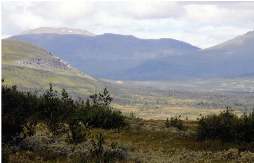
Figur 2. Vid rätt väderlek syns bergknallen på långt håll på grund av sin speciella gulaktiga färg.

Efter Sundströms artikel 1988 hände egentligen inte så mycket med skelettet från Gransjön. Det förvarades i Jamtlis arkeologiska magasin