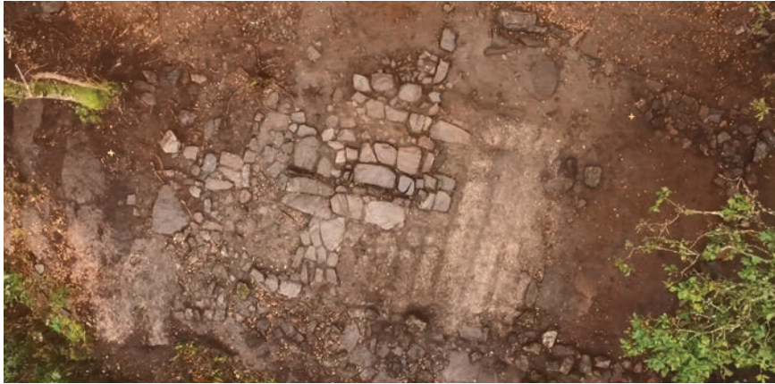
Figur 2. Torpet Tjuvkil i Bohuslän undersöktes 2017. Torpet etablerades kring år 1810 och existerade fram till mitten av 1800-talet. På bilden ses boningshuset med härden i ett rum mitten av huset och två kammare på ömse sidor.

med den som framträder i skriftliga källor.