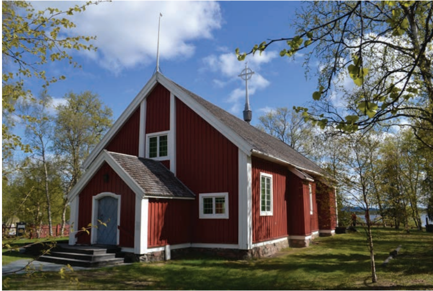
Figur 6. Jukkasjärvi kyrka, uppförd under 1600-talet.

den uppfördes. Genom koppar- och mässingshandeln och den monopolliknande positionen hade bröderna också kontroll över en av den atlantiska ekonomins mer eftertraktade varor. Mässingen såldes ofta som tråd till Nederländerna och senare till England där den blev till nålar, hyskor och hakar till korsetter och andra spännen. Fyndet av det så kallade Læsø-vraket i Öresund på 1950-talet gav en direkt bild av mässingsexporten. Stora mängder mässingstråd stämplade med familjerna De Geers och Momma-Reenstiernas vapen påträffades ombord. Skeppet hade uppenbarligen förlist på sin väg från Norrköping till Amsterdam (Helmfrid 1959; Nilhamn 2012; jfr även Zahedieh 2013).