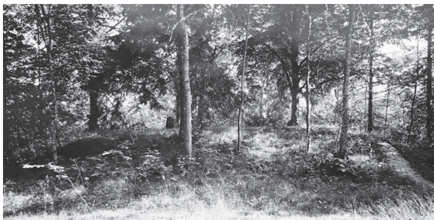
Figur 3. "Signhilds kulle", fornlämning 39, före skogsröjning. Stenstolen något till vänster om bildens mitt. Foto Harald Faith-Ell 1926 (ATA).

Tingshögen i Gamla Uppsala och Tynwald Hill på Isle of Man stannade utgrävaren för att det handlade om en tingshög (Sjösvärd 1991). (Figur 4.)