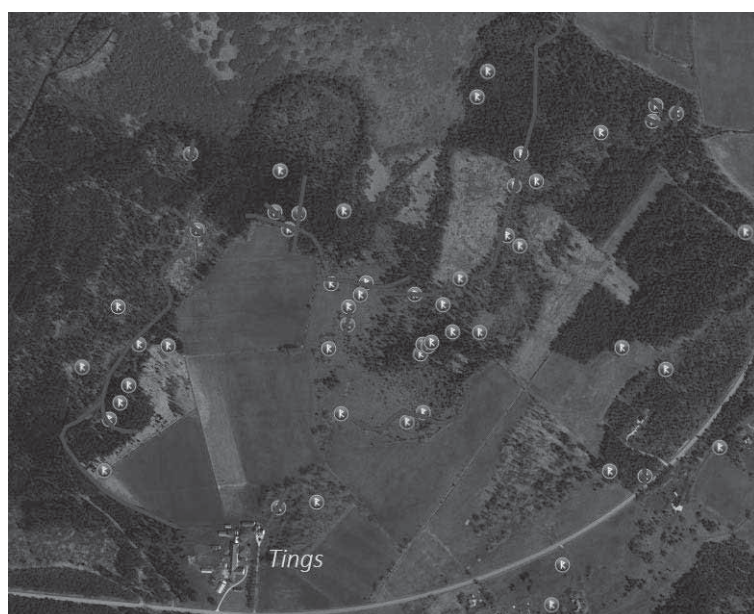
Bild 6b. Skattdokumentens Tingzgärdet och Tingzhagen låg söder om Bäl kyrka men ägdes i sin helhet av gården Gute. Peder Gute var tingsdomare i Bäl ting under åren fram till domstolsreformen 1618, vilket kan vara en anledning till att marken ägdes av just Gute. Ett större gravfält har varit beläget på grusåsen på ömse sidor om kyrkan men är till stor del borta idag. Enligt ortnamnsforskaren Ingemar Olsson har Bäl fått sitt namn av grusåsen, på vars sydsluttning kyrkan ligger. Kartan är hämtad ur Östergren 2018.

Bild 6c. Gården Tings i Kräklingbo ligger på gränsen till Ala socken. Namnet bör innebära att gården varit en del av tingsorganisationen. Gårdens inägomark är omgiven av ett omfattande stensträngssystem och i dess östra utkant finns fortfarande två grupper med sammanlagt åtta husgrunder från äldre järnålder. Kartan är hämtad ur Östergren 2018.