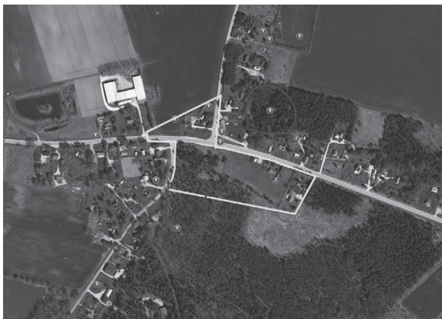
Figur 8a och b. På en storskifteskarta från 1795 över gården Broe i Halla socken finns Kuppe Tingsrum och Kuppe Tingsåkrar markerade. Ågorna ligger vid vägskalet mitt i det så kallade Broegravfältet i södra delen av Halla socken och sydöst om Roma samhälle. Namn som Rörhagen samt Lilla och Stora Röråkern norr om vägskalet antyder att gravfältet haft en betydligt större utbredning än vad som är känt idag. Att tingsnamnen inte finns angivna på skattdokumentationen kan förklaras med att denna karta sällan innehåller detaljer i perifera områden i socknarna. Kartorna är hämtade ur Östergren 2018.