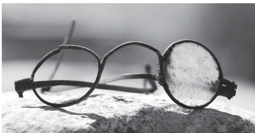
Figur 6. En del föremål gör att man kommer närmare de människor som av olika anledningar befunnit sig vid galgen. Man undrar vem den var som glasögonprydd begav sig till galgbacken men kom hem utan. Om hen alls kom hem?

grund grop utan markering, avsedd att glömmas bort.