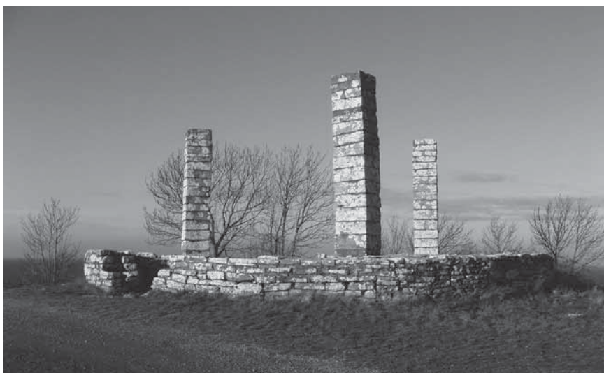
Figur 1. Galgen idag.

och Carl Gustaf Styf för förmodligen första och säkerligen sista gången” (Lundgren 2003, s. 23).