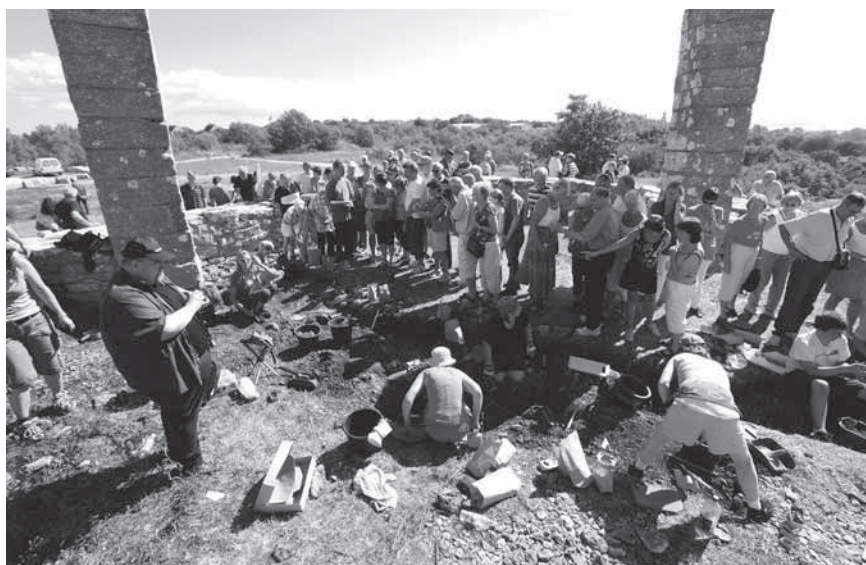
Figur 4. Intresset för undersökningen av den gamla avrättningsplatsen var stort.