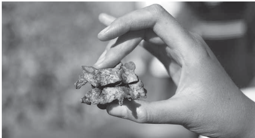
Figur 8. Personen som låg i den övre kistan hade fått huvudet och resten av kroppen åtskilda mellan den fjärde och femte halskotan.

Att galgen som anläggning bar på ett juridiskt budskap står klart. Kanske bar galgen under den senare medeltiden också med sig ett