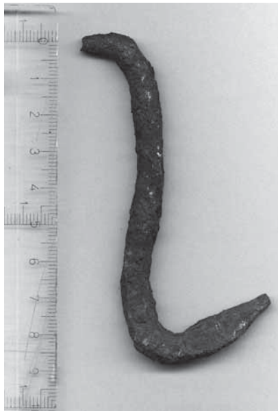
Figur 7. Under galgen hittades en krok som av utformningen att döma har suttit fastnaglad i trä. Kanske har den använts för att fästa upp avhuggna kroppsdelar, androm till varnagel?

De brända ben som hittats på avrättningsplatsen är sannolikt rester av några av de kvinnor som avrättats här. Kvinnor som dömdes till döden fick ofta det skärpta straffet att brännas, i de allra flesta fallen efter att de avrättats, åtminstone under 1600- och 1700-talen. När det gäller dödsstraff som tilldömts kvinnor på Gotland är brottet bakom domen ofta barnamord. År 1651 dömdes en Ursula till att avrättas. Hon skulle halshuggas och brännas på bål (Rötter, 1). En snarlik dom föll 1662 för Brita Pedersdotter, en piga från Lundebiers i Lummelunda