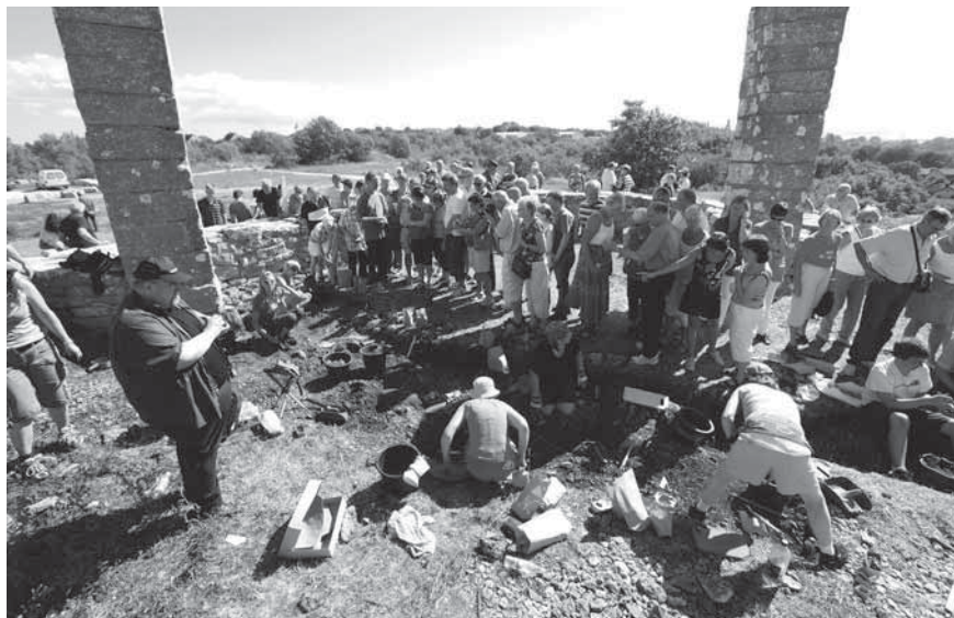
Figur 4. Intresset för undersökningen av den gamla avrättningsplatsen var stort.