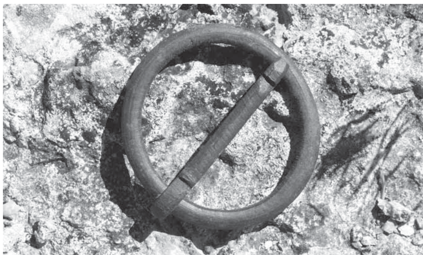
Figur 5. Bilden visar ett föremål ur den vanligaste fyndkategorin vid galgen, nämligen spännen, som sko-, bältes- eller dräktspännen av järn och brons av olika typer och storlekar.