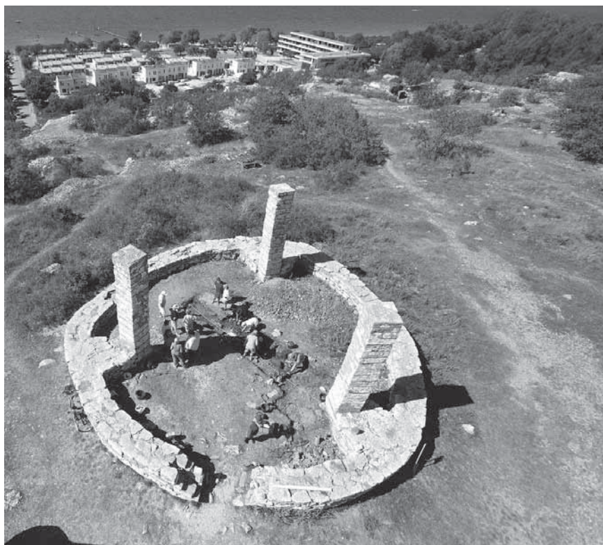
Figur 3. Galgen från ovan.