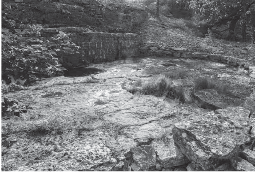
Figur 3. Flyktingkällan sedd från norr. Notera stubben efter pilträdet till höger.

grenar anses symbolisera sorg – men även återuppståndelse – och som därför haft en given plats på kyrkogårdar (Bengtsson & Bucht 1992; jfr Deetz 1977, s. 69–72). Vid den minnesstund som hölls på Flyktingkällan deklamerade en representant för Lettiska Akademiska Nationers Förbund tanken bakom detta gröna tillskott till minnesmärket: