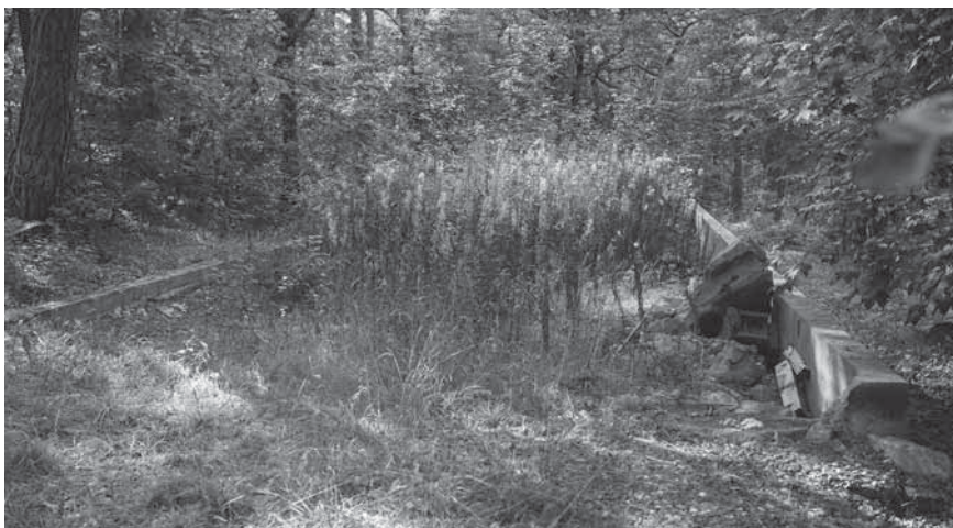
Figur 4. Grunden efter den större före detta militärbaracken.

70-årsdagen av de i mottagningslägret förlagda flyktingarnas ankomst till ön. Eftersom tillståndet dröjde fick dock planteringen, som denna gång bevittnades av 20-talet personer, istället ske senare samma sommar (Strautmåne 2015).