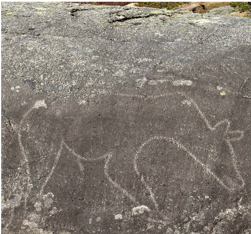
Figur 4. Bjørn avbildet på en slipt helleristning og ut fra høyde over havet er denne type bergkunst anslått til å være opptil 10 000 år gammel.

rein og elg slik som reinen på den nordligste hellemalingslokaliteten i Skandinavia, Lafjord i Nordkapp kommune (Helberg 2016, s. 99).