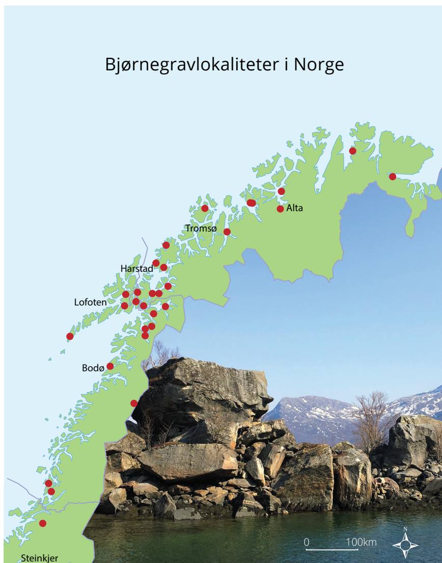
Figur 1. Utbredelse av bjørnegraver i Norge. Et typisk landskapstrekk ved gravene langs kysten er at bjørnebeinene ligger under store steinblokker. Bjørnegrav i Nevelsfjord i Bodø kommune datert til 11-1200 tallet. Foto: Ingrid Sommerseth, Grafikk: Grafiske tjenester, Norges arktiske universitet UiT.

tradisjonene og de rituelle handlingene. De tidligste kildene finner vi i de mange misjonsberetningene fra 1600 og 1700-tallet (Niurenius 1645; Rheen 1671; Schefferus 1673; Dass 1739; Fjellström 1755; Leem 1767; Friis 1871). Utover