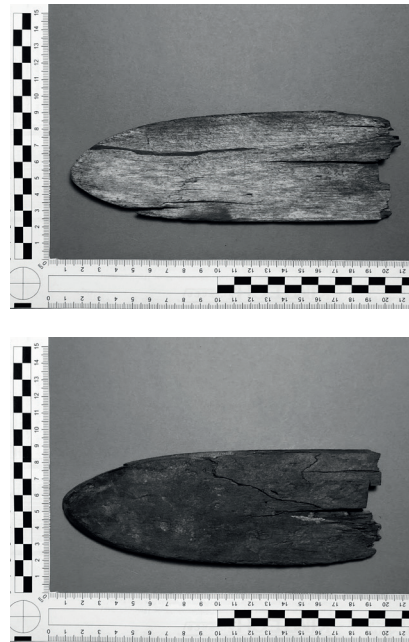
Figur 3a och 3b. Fotografi av Loktačohkka-skidan, a. framsidan, b. baksidan.

Skidfragmentet kommer mest troligen från den högra skidans framspets med tanke på det tydliga slitaget samt avsaknaden av skåra. Det går inte att avgöra skidans ursprungliga längd, däremot kan vi med stor sannolikhet, uppskatta skidans maximala bredd till cirka 70 millimeter (Fig. 3a–b). Med tanke på tidigare påträffade/upphittade