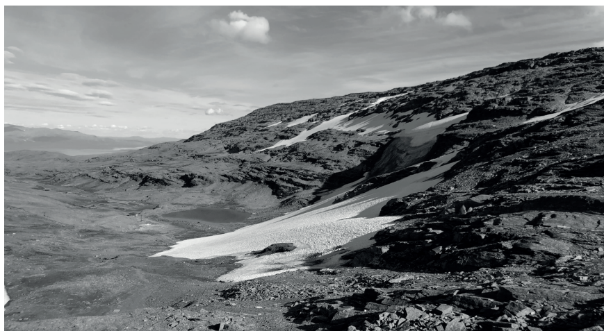
Figur 2. Fotografi av Loktačohkka-glaciären mot öster, taget den 9 augusti 2018.