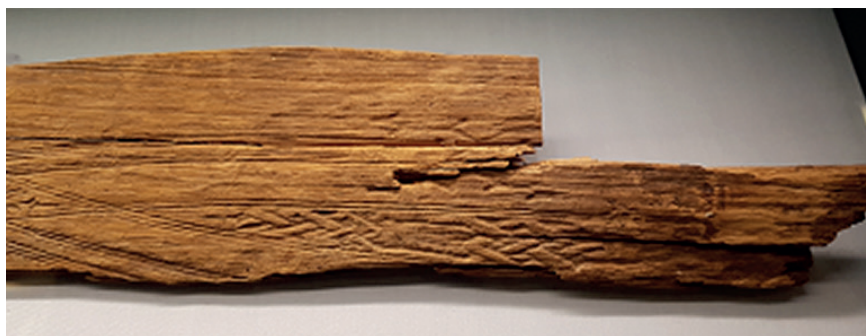
Figur 1. Skidan från Brännbacken, Arjeplog, Lappland.

Samer var berömda skidtilverkare, troligen redan på järnåldern. En man har under vendeltid (550–750 e.v.t.) begravts vid stranden av Stora Drocksjön, i gränstrakterna Härjedalen-Hälsingland, med sju små hyveljärn, lämpliga för att hyvla trä till skidor. Fynd av det här och liknande slag betraktades först som depåfynd, innan man insåg att det rörde sig om gravar (Sundström 1989, s. 23–30; Holm 2016).