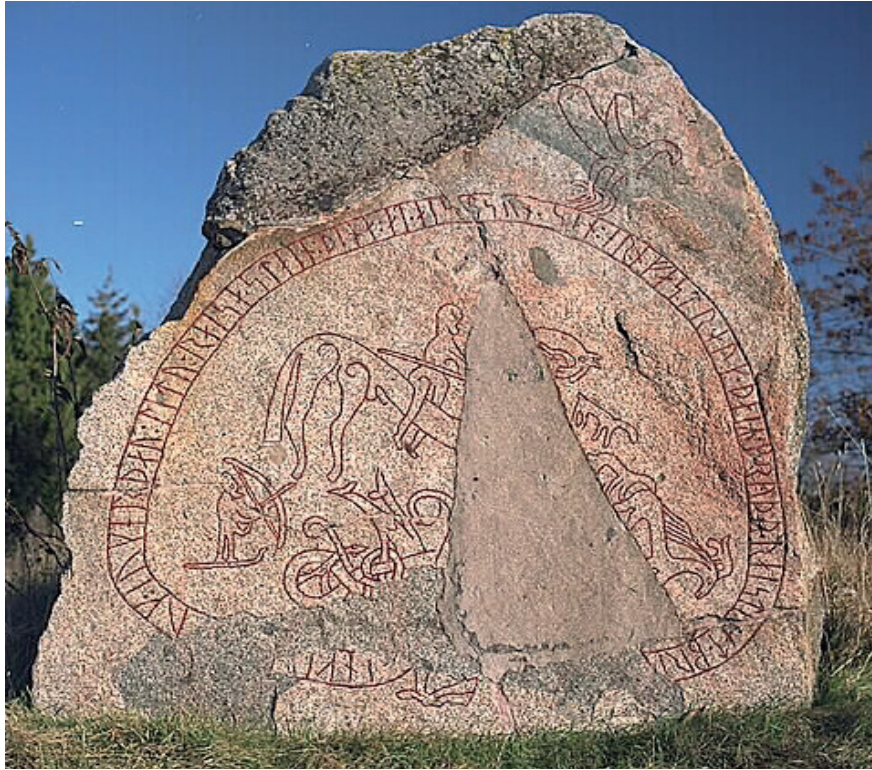
Figur 5. Runsten vid Böksta, Balingsta sn, Uppland, omkring 1050 e.v.t. En skidåkare med båge står nere i vänstra hörnet.

till häst med ett spjut samt en annan man, som har en båge i sin ena hand och en stav i sin andra. Han är något större än ryttaren, och står på en linje, "steht auf einer ansteigenden Standlinie" (Hauck, Axboe et al. 1985a, s. 330). Kent Andersson skriver om "en figur med en pilbåge eller möjligen en stav i handen ... mannen tycks stå på ett par skidor ... en lokal hövding ... (eller) ... en allegorisk figur som ... visar att ryttaren besegrat en stam eller grupp som använde sig av skidor?" (Andersson 2020, s. 49).