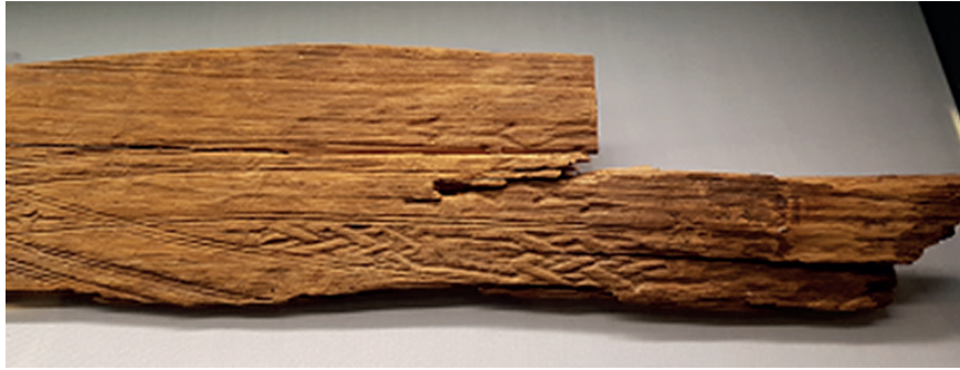
Figur 1. Skidan från Brännbacken, Arjeplog, Lappland.

Samer var berömda skidtilverkare, troligen redan på järnåldern. En man har under vendeltid (550–750 e.v.t.) begravts vid stranden av Stora Drocksjön, i gränstrakterna Härjedalen-Hälsingland, med sju små hyveljärn, lämpliga för att hyvla trä till skidor. Fynd av det här och liknande slag betraktades först som depåfynd, innan man insåg att det rörde sig om gravar (Sundström 1989, s. 23–30; Holm 2016).