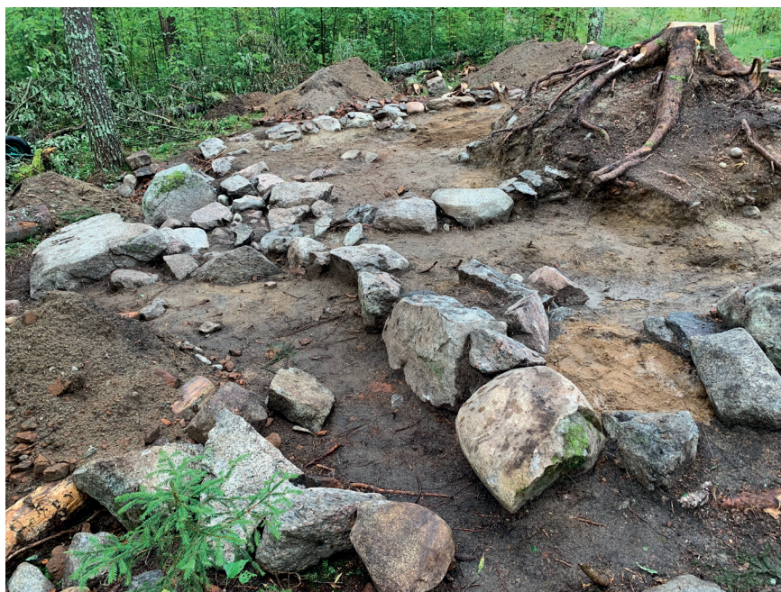
Figur 5. Husgrunden på "Lappens".

Precis som på det äldre bostället var det osteologiska fyndmaterialet omfattande. Totalt tillvaratogs 5,5 kilo djurben. Nöt och häst dominerar. En stor del av benen är mörgpaltade, även de av häst, vilket visar att hästen inte bara slaktats utan även ätits. Precis som på det äldre bostället är detta anmärkningsvärt. Ätande av hästkött betraktades närmast som tabu i Norden (Egardt 1962), men bland en del samer kom hästkött att ses som tjänlig föda och förefaller utvecklats till ett distinkt inslag i sydsamiska mattraditioner.