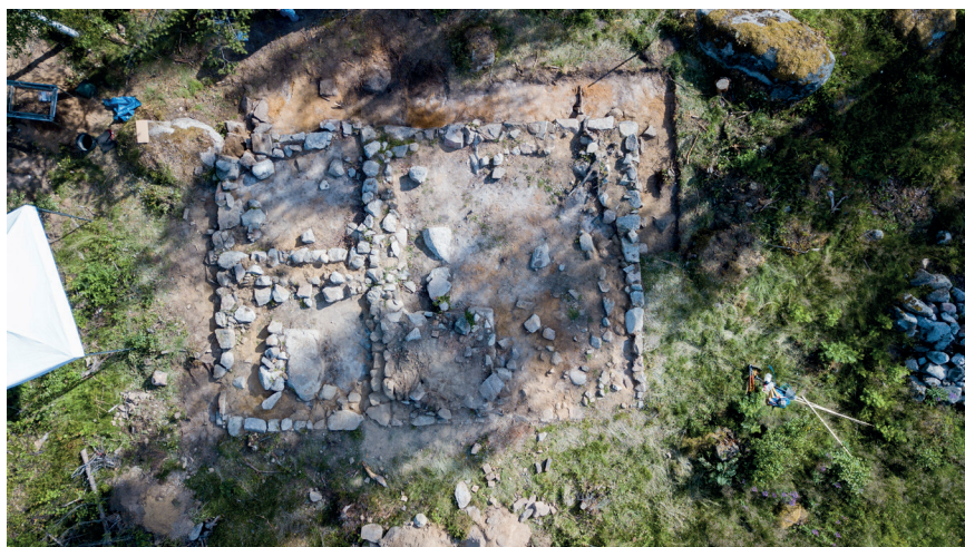
Figur 3. Drönbild över husgrunden på "Lappatäkten". Till höger i bild, syns grunden efter storstugan med spisröset i vänstra hörnet, kammare och farstu till vänster (spridningstillstånd LM 2019/020491).