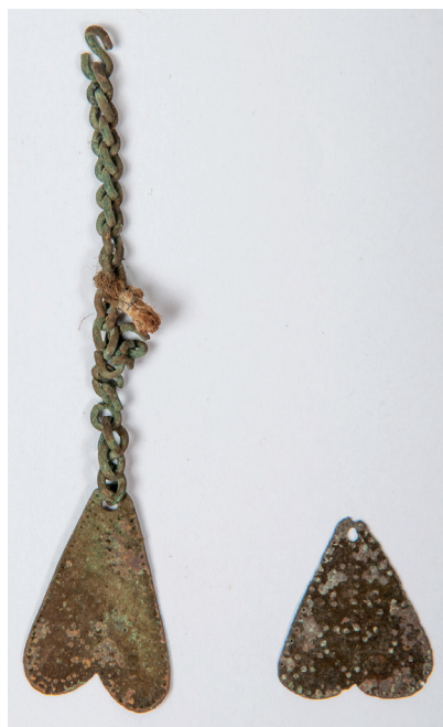
Figur 4. Hängen av kopparlegering påträffade vid undersökningen av stugan i Lappatäkten.