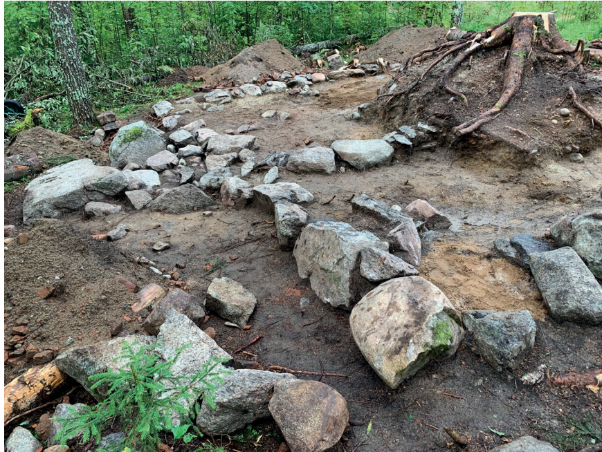
Figur 5. Husgrunden på "Lappens".

Precis som på det äldre bostället var det osteologiska fyndmaterialet omfattande. Totalt tillvaratogs 5,5 kilo djurben. Nöt och häst dominerar. En stor del av benen är mörgpaltade, även de av häst, vilket visar att hästen inte bara slaktats utan även ätits. Precis som på det äldre bostället är detta anmärkningsvärt. Ätande av hästkött betraktades närmast som tabu i Norden (Egardt 1962), men bland en del samer kom hästkött att ses som tjänlig föda och förefaller utvecklats till ett distinkt inslag i sydsamiska mattraditioner.