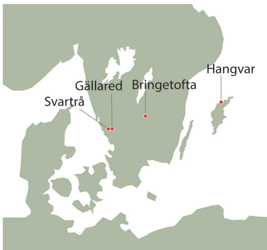
Figur 1. Karta med Gällared, Bringetofta, Hangvar och Svarträ kyrkor utmärkta. I de tre första kyrkorna har fosterbegravningar hittats och från Svarträ kyrka finns ett historiskt dokumenterat exempel på hur en hemlig fosterbegravning kunde gå till. (Karta: Anders Andersson, Kulturmiljö Halland).

I likhet med andra typer av efterreformatiska gravar inne i kyrkor, kryptor och kapell har kategorin fosterbegravningar inte självklart klassats som en fornlämning, och det är långt ifrån givet att de undersöks av arkeologer. I vissa fall har kyrkans personal identifierat askarna som begravningar, och återbegravt dem på kyrkogården utan att konsultera museerna (Hagberg 1937, s. 510; Bø 1960). Fallstudierna som beskrivs i den här artikeln visar på värdet av noggranna undersökningar av fosterbegravningarna, men också