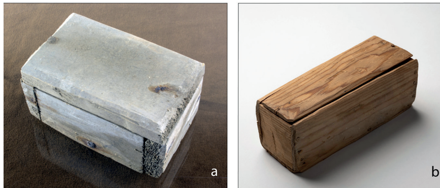
Figur 2 (a) Den stängda asken från Gällared innehållandes det svepta fostret (10,7 x 6,8 x 5,3 centimeter). (b) Asken från Bringetofta (15 x 6 x 6 centimeter).

att detta måste ske med hänsyn till de etiska aspekterna och i en respektfull dialog med kyrkans företrädare. Här utgör undersökningen av fosterbegravningen i Gällared ett exempel på hur det går att samarbeta och nå lösningar som är godtagbara för såväl arkeologer som kyrkan.