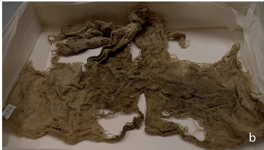
Figur 5. Textilsvepningarna som använts för att linda fostren. Fläckarna på tygen indikerar var fostren var placerade. (a) Insidan av svepningen från Gällared (14,7 x 8,5 centimeter). (b) Insidan av svepningen från Bringetofta (cirka 30 x 55 centimeter).