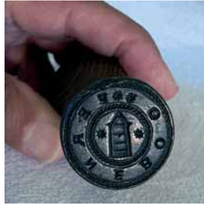
Figur 6. Stampen till Österfärnebos socken- sigill stals 1813, samtidigt med kyrksilvret, men kom tillbaka 1956 och är åter i församlingens ägo.

Idén om att Barbara kan ha varit Österfärnebos kyrkohelgon har på senare år förts fram av ovannämnde Tord Andersson, samme forskare som först uppmärksammade pro-