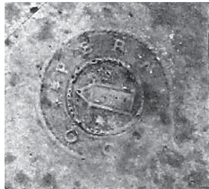
Figur 7. Österfärnebos sockensigill i papper och vax i mantalslängd från 1633. Äldsta belägg för användandet. Österfärnebos kyrkoarkiv, Landsarkivet, Härnösand.

sten Wittinghs omnämnande av Sankta Barbara (1971; 2011). En- ligt muntlig uppgift av Bengt Ing- mar Kihlström (i Andersson 2011) var också denne framstående kän- nare av medeltida kyrkoliv benägen att se Barbara som Österfärnebos patronus. Också i kyrkans infor- mationsbroschyr, utgiven av ärke- stiftet, framförs denna uppfattning