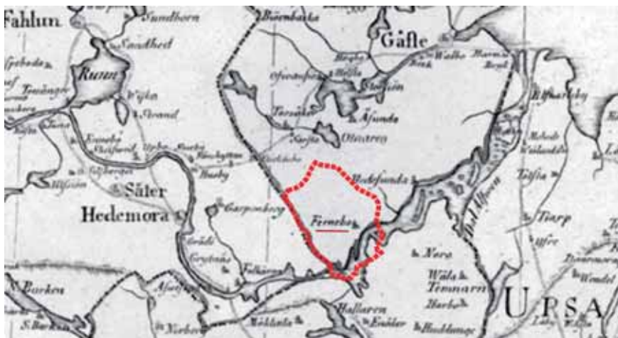
Figur 1. Österfärnebo ligger vid nedre Dalälven och i sydligaste Gästrikland. Närmaste grannsocknar är i norr Torsåker och Årsunda, i öster Hedesunda, i söder Nora och i väster By. Bildunderlaget är en landskapskarta från ca 1795.

batter i sockenstämman togs 1796 beslut om en ny kyrka. Men kort därefter drabbades bygden av flera missväxtår och därpå utbröt ryska kriget. Bygget drog ut på tiden. Det var i stort sett klart 1822 men invigningen kunde äga rum först 1827. Den medeltida kyrkan fick stå kvar strax intill den nya till 1830, då den revs.