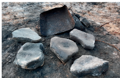
Bild 1. Fem av de bokningsstenar som påträffades vid undersökningen av Dammens hytta tillsammans med ett fyllfat som använts för att bära kol eller järnmalm.

Trots att verksamheten pågått under så pass lång tid var spåren på platsen förvånansvärt få. Endast rester av ett par enkla skjul för förvaring av järnmalm hittades. Fyndmaterialet var mycket sparsamt och bestod av enstaka keramikskärvor, kritpipor och djurben. Däremot hittades en stor mängd så kallade bokningsstenar (bild 1). Själva masugnen förstördes helt då järnvägen drogs fram på 1870-talet och en kättingsmedja och en såg byggdes på platsen. Aktiviteterna vid hyttan företogs sannolikt bara i perioder när det fanns tillräckligt med vatten för att driva bälgarna vilket gjort att man inte varit i behov av några mer permanenta byggnader, förutom masugnen.