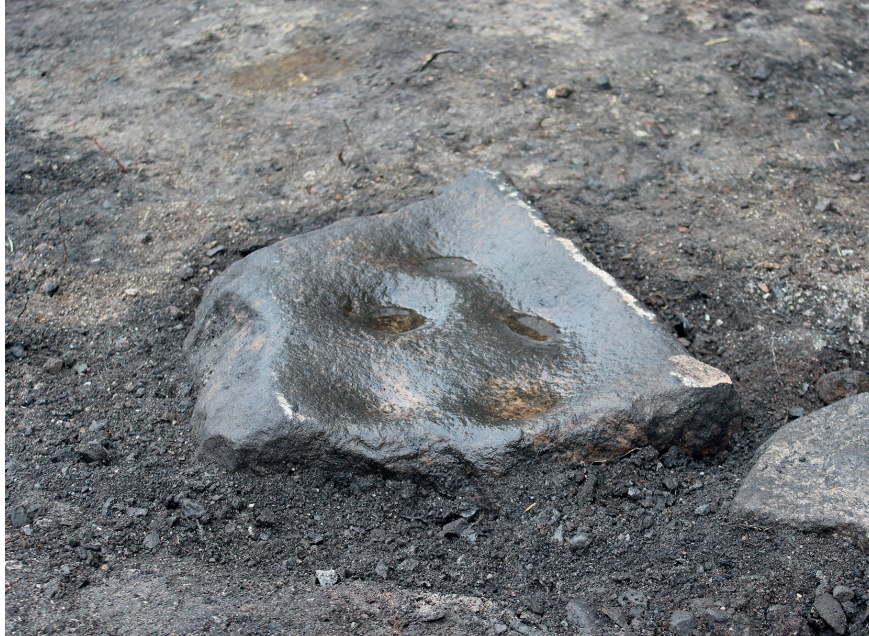
Bild 2. En av bokningsstenarna låg på hyttbacken, sannolikt på den plats där den använts.