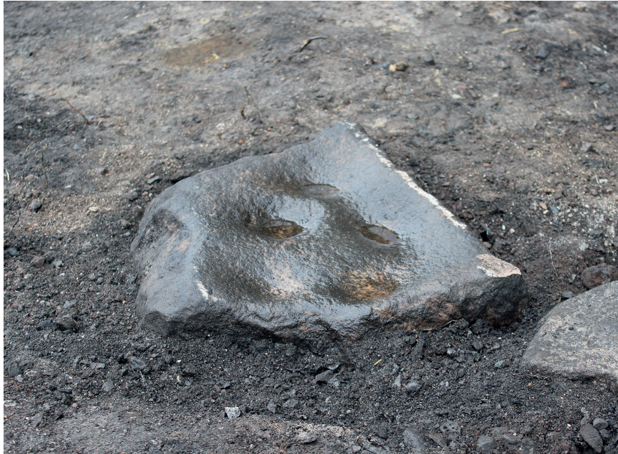
Bild 2. En av bokningsstenarna låg på hyttbacken, sannolikt på den plats där den använts.

sköttes av kvinnor, barn och ”sämre arbetare” (Rinman 1788–89, Florén 1995, s. 32). Arbetet ansågs alltså så enkel att vem som helst kunde utföra det. 1779 listas pigan Kajsa vid Dammens hytta i mantalslängden och hon uppges vara bokerska (Mantalslängder 1642–1820, Örebro län, 1779). Någon annan med denna titel har inte kunnat hittas vid Dammen. Detta beror sannolikt på att de som bokade malm oftast inte var specialiserade utan även utförde en rad andra mindre kvalificerade arbetsuppgifter vid hyttan. Vid bergsmanshyttorna stod förmodligen bergsmännens egna familjer för större delen av arbetet.