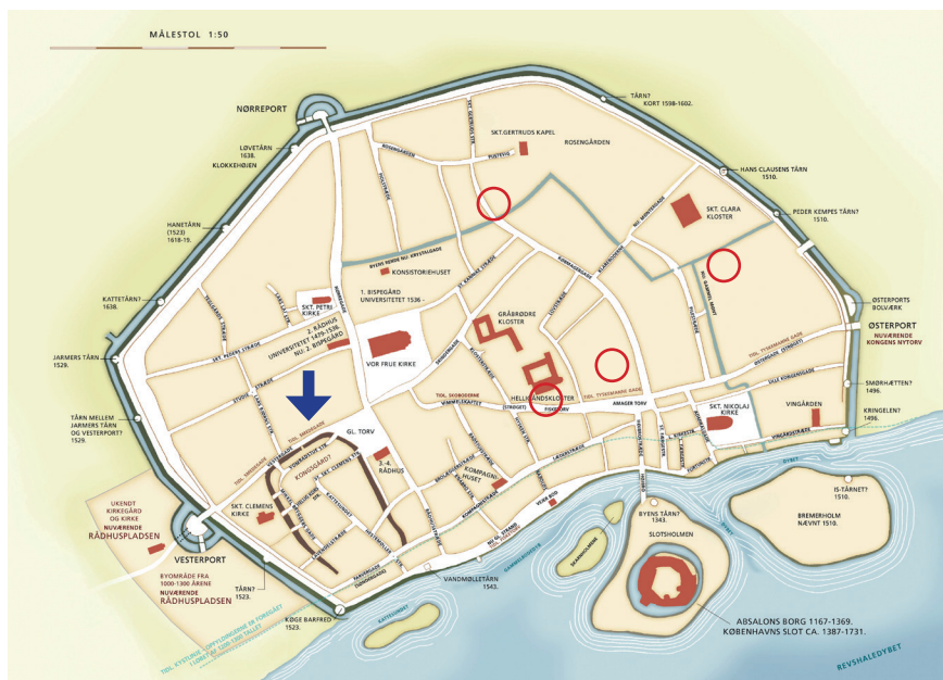
Figur 1. Rekonstruert kart over København med et utvalg av kjente bygninger og anlegg under høy- og senmiddelalderen. «Clemensstaden» og halvkretsvollen er markert med en blå pil innenfor den sørvestlige delen av byen. Hentet fra Fabricius 2021, s. 106–107. Gjenbruk godkjent av forfatteren.

9–10 m bred og opptil 1,25 meter høy jordvoll bygget av naturlig leire og moldjord i ulike sjikt. Grøften på utsiden skal ha vært 8 meter bred og på enkelte steder mer enn 3 meter dyp (jf. Rosenkjær 1906, s. 48; Ramsing 1908, s. 411–413 og 422; 1910, s. 500; 1940, Bd. I, s. 42 og 82; Bd. III, s. 48–49) (Fig. 2).