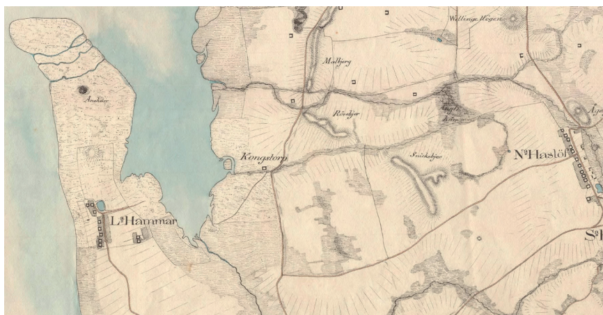
Figur 7. Snickebjør mellom Foteviken og Norra Haslöv. Nærmere Foteviken ligger Kongstorp (Stora Hammar 22:1), en gårdstomt og gård som skal ha blitt lagt øde på 1300- og 1400-tallet. https://sok.riksarkivet.se/Home/?postid=Arkis+30c3c29b-cbdb-479a-b715-9102997bd90&flik=1&s=Balder Utdrag fra originalkart hentet fra Riksarkivet/Krigsarkivet och samlingen Topografiska kårens kartor, Skånska rekognoceringskartan 1812 . Gjenbruk godkjent av Riksarkivet.