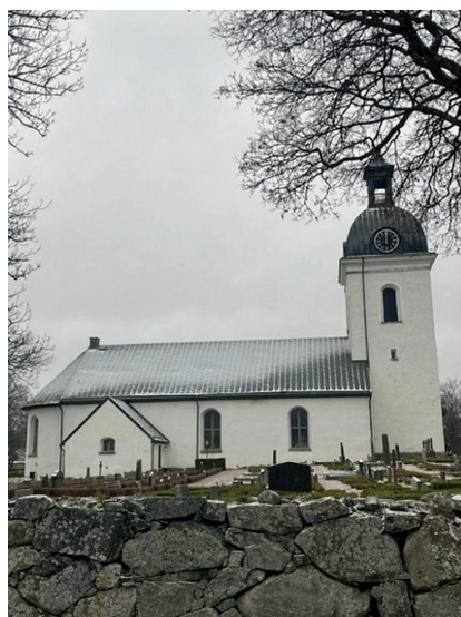
Fig. 1: Åseda kyrka, bild tagen från norr. Foto: Elias Engdahl, december 2022.

Liepe och Ullén har genom detta arbete bidragit med relevans och förståelse av de arkeologiska fynd som har gjorts i Åseda kyrka. Där- emot har föremålen inte diskuterats i någon vidare grad mer än deras datering. Syftet med denna artikel är därför att undersöka och tolka de bemålade bitarna av fönsterglas, mynten och en specifik murad konstruktion under koret. Hur reflekterar dessa arkeologiska fynd Åseda socken under medeltiden? Bör dateringen av dessa föremål användas som en motpol för dateringen av sal-