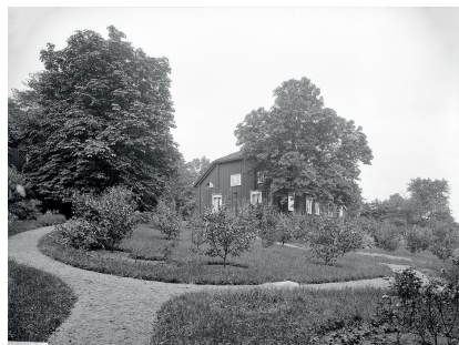
Figur 4. Asby prästgård med trädgård 1905. De organiskt formade ytorna kombinerar nytto- och lustträdgården där såväl fruktträd, (bär-)buskar, gångstigar och gräsytor ryms. Foto: A. C. Hultgren. OM.H.000037, Östergötlands museum, CC-BY-NC.

av parkliknande herrgårdsmiljöer (Flinck 1994:123). Under 1800-talet anammas den så kallade tyska stilen (fig. 4) med en blandning av regelbundna och organiska former, såsom slingrande gångar och rundade eller droppformade kvarter – en kombination av barockträdgård och engelsk park (Flinck 1994:92; Nohlin 2023:60).