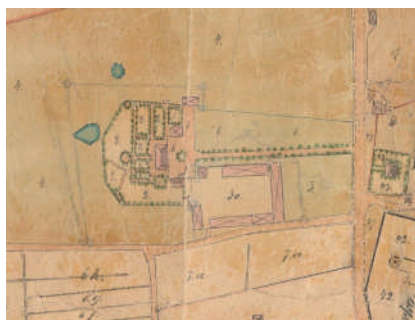
Figur 5. Östra Eneby prästgård 1861–62, med trädgården belägen på baksidan av manbyggnaden. De aktuella odlingsbäddarna har legat norr om allén, närmast gårdsplanen.

Trots att bärfröer är mycket vanligt förekommande i arkeologiska kontexter från historisk tid finns få säkra belägg på faktisk odling av bär; vad gäller odling av hallon är materialet ännu skralare. Med mycket stor sannolikhet är det just en hallonodling som dokumenterats i vid Östra Eneby prästgård, även om