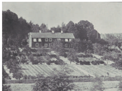
Figur 3. Stenbro prästgård (Södermanland) med typisk nyttoträdgård, troligen 1860-tal.

Vad däremot förändras i prästgårdarnas trädgårdar under perioden efter 1600-talet är själva utformningen. Från att ha utgjort en nyttoträdgård med motsvarighet i bondgårdarnas kålgårdar (fig. 3) blir prästgårdsträdgårdarna under 1600- och 1700-talet alltmer inspirerade