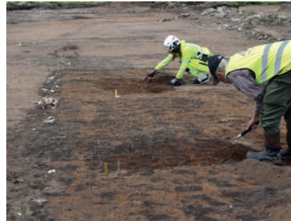
Figur 2. Parallella rader med spadstick rensas fram. Till vänster syns ett av de benfyllda dikena.

De senaste årtiondenas trädgårdsarkeologi har identifierat ytor med spår efter spadbruk som en tydlig indikation på småskalig odling, vanligtvis trädgårdsodling (Lindeblad & Nordström 2014:36; Andréasson Sjögren 2025:331). Men till skillnad från det oregelbundna gytter av spadstick som sådana lämningar normalt uppvisar avtecknade sig spadstickan vid Östra Eneby prästgård som långa, parallella rader (fig. 2). Stickan, som var ovanligt stora och upp till 0,21 meter breda, var i huvudsak halvmånformade med den raka sidan åt öster eller söder.