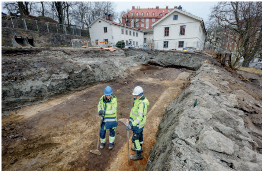
Figur 3. Här syns tydligt de tjocka lerlager som förts på för att jämna ut terrängen. Under dem ser vi spår av den äldsta trädgården. De mörka partierna är odlingsbäddar, de ljusa är sandgångar. I bakgrunden ser vi landeriets byggnader.

Ett av de viktigaste resultaten från undersökningen blev i stället de stora omdaningar av platsen som skett under den korta period den var i bruk. Omfattande resurser hade lagts på att skapa och omskapa trädgården genom sprängning av berg, påförande av massor och konstruktion av murar (figur 3). Förändringarna avspeglas inte fullt ut i de historiska kartorna, då dessas tvådimensionalitet döljer de omfattande arbetena med att omforma terrängen. Arbetena gjordes i flera omgångar och initierades av olika