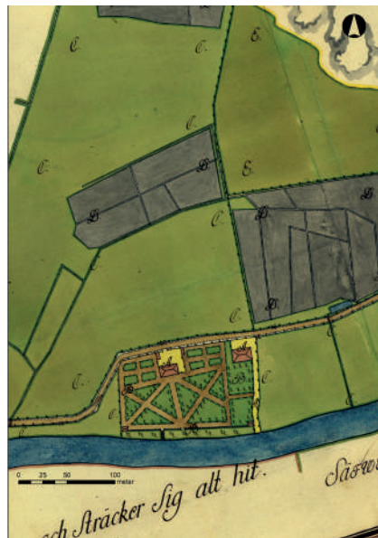
Figur 8. Gamlestadens landeri 1769.